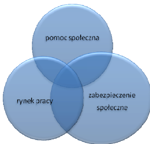
Rys. 1. Podsystemy bezpieczeństwa społecznego w obszarze egzystencji

Biorąc pod uwagę przedstawione definicje bezpieczeństwa, można z systemu bezpieczeństwa społecznego wyodrębnić podsystemy sensu stricto : pomocy społecznej, rynku pracy oraz zabezpieczenia społecznego.