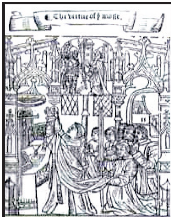
Rys. 1. Obraz przedstawiający scenę poddania się angielskiego duchowieństwa pod jurysdykcję Henryka VIII. Autor nieznany

ników tych spotkań należał William Tyndale, który ratując się przez prześladowaniami, uciekł do Niemiec. Tam dokonał przekładu Nowego Testamentu na język angielski, który w obiegu pojawił się w Anglii już 1526 r. Od tego momentu dwór Henryka VIII i ortodoksyjni humaniści angielscy rozpoczęli ostrą batalię przeciwko luteranckim herezjom. Skuteczność rządowej kampanii nie zdołała zahamować szerzącej się modzie na luteranckie poglądy, ale mimo wszystko przenikanie luteranizmu aż do czasu schizmy było słabe 1 .