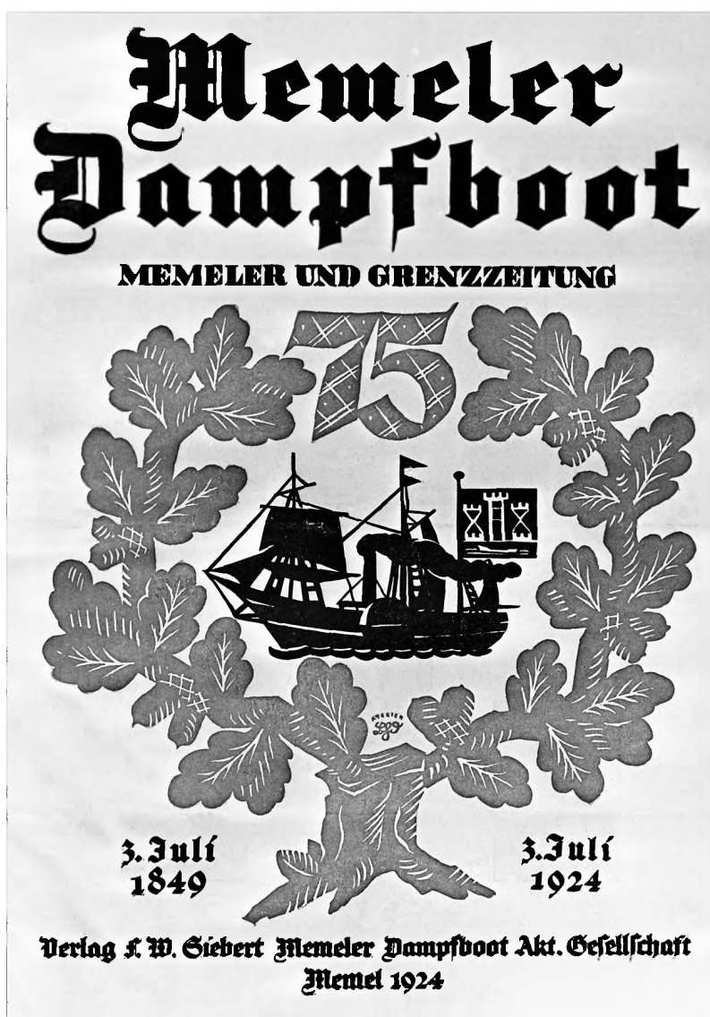
Pierwsza strona tygodnika „Memeler Dampfboot” z 3 lipca 1924 roku