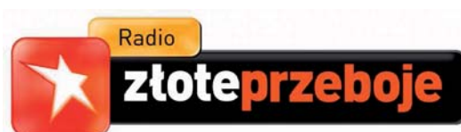
Fot. 4. Radio Złote Przeboje na 105,6 MHz