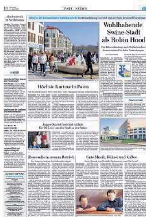
Fot. 3. „Insel Usedom/Wyspa Uznam”, cotygodniowa kolumna w „Ostsee-Zeitung”. Wydanie z 17 kwietnia 2012 roku

dotyczące oferty turystycznej i handlowej (nowo powstałego hotelu 34 czy budowy świnoujskiego centrum handlowego 35 ), aktywnego wypoczynku (sylwetka maratończyka Piotra Andrzejewskiego 36 czy informacja o cyklicznie organizowanych wycieczkach do „Kamiennego Stołu” w lasach Heringsdorfu) 37 . Nie brakuje informacji dotyczących ważnych spraw miejskich, jak budżet miasta 38 , podwyżki cen wody 39 czy opłaty klimatycznej 40 , a także nowej siedziby firmy Remondis zajmującej się wywózką odpadów 41 .