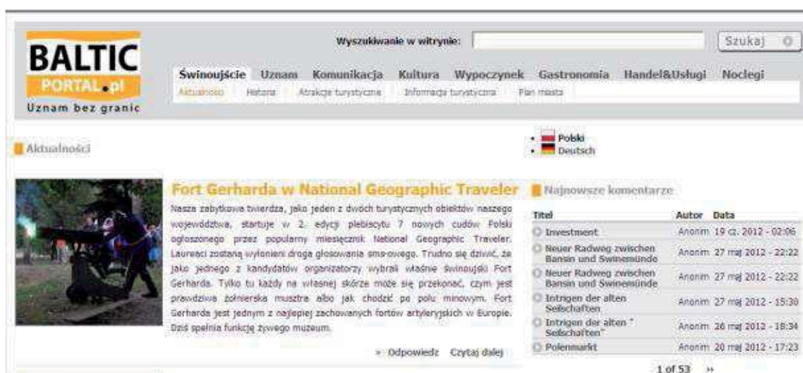
Fot. 1. Skan strony portalu