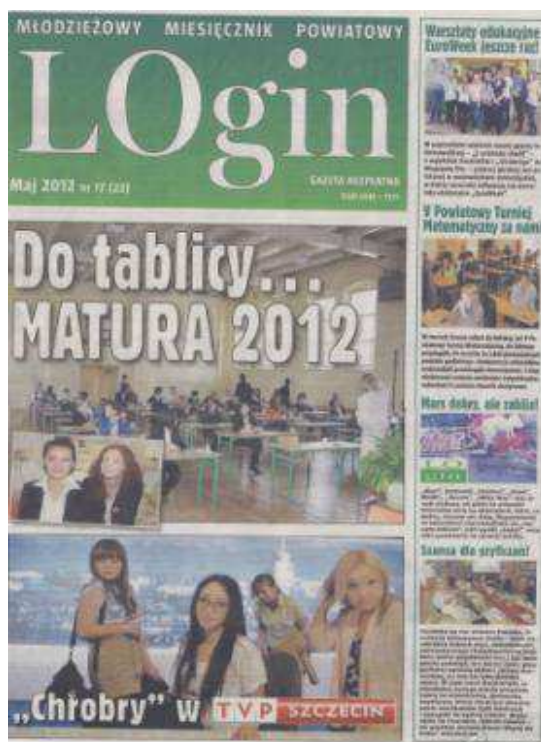
Fot. 1. „LOgin. Młodzieżowy Miesięcznik Powiatowy”, Liceum Ogólnokształcące im. Bolesława Chrobrego w Gryficach

Pismo ma przejrzystą szatę graficzną. Na każdej „jedyńce” pisma zamieszczane są zdjęcia oraz krótkie zapowiedzi głównych tematów numeru. Struktura i forma miesięcznika świadczą o sprawnie funkcjonującym zespole redakcyjnym, na łamach pisma znajdują się ciekawe infografie lub różnego rodzaju infografiki 9 .