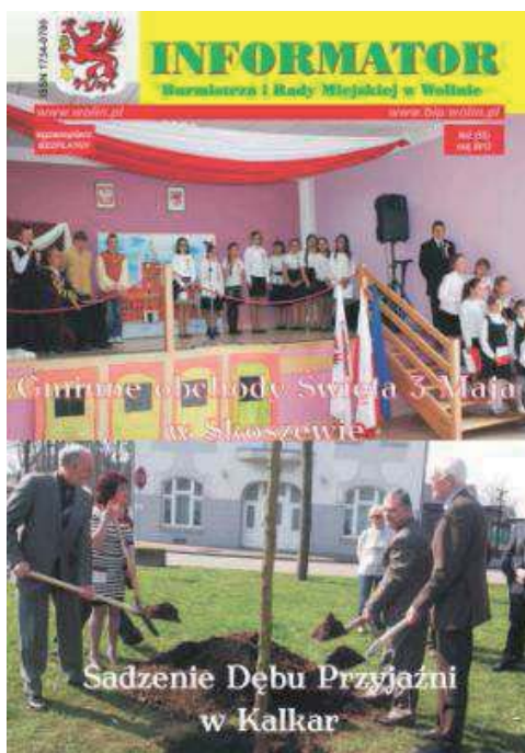
Fot. 12. „Informator Burmistrza i Rady Miejskiej w Wolinie”. Numer 2 (55) z maja 2012 roku

Pismem wyraźnie deklarującym już w tytule swój charakter wydawniczy jest „Informator Burmistrza i Rady Miejskiej w Wolinie”. Posiada rejestrację sądową oraz międzynarodowe oznaczenie wydawnictw ciągłych, spełniając tym podstawowe wymogi formalne przewidziane dla wydawnictw prasowych. Zawiera prawie wyłącznie informacje o działalności dwóch gminnych organów władzy samorządowej w Wolinie. Rozdawany za darmo, finansowany jest ze środków gminy.