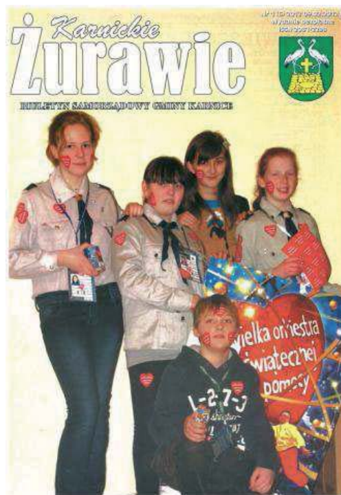
Fot. 10. „Karnickie Żurawie. Biuletyn Samorządowy Gminy Karnice”. Numer 1 (6) z 9 lutego 2012 roku