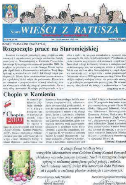
Fot. 9. „Nowe Wieści z Ratusza. Informator Samorządowy”. Numer 1 (33)

Do segmentu tematyki ogólnej zalicza się informacyjny tytuł „Nowe Wieści z Ratusza. Informator Samorządowy”. Wydawany przez Urząd Miejski w Kamieniu Pomorskim posiada cechy bardziej biuletynu aniżeli typowego tytułu prasowego. Decydują o tym takie elementy jak brak rejestracji sądowej, nieregularne ukazywanie się, sposób druku i kompletacji egzemplarzy. Tytuł jest wydawany i całkowicie finansowany przez urząd (rozdawany bezpłatnie), zawiera teksty wyłącznie informacyjne, nie zawiera reklam.