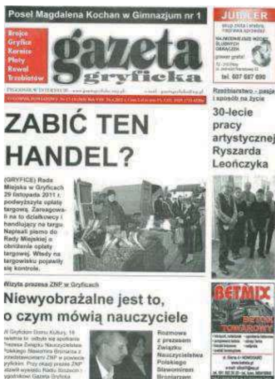
Fot. 3. „Gazeta Gryficka”. Numer 17–18 (368) z 2012 roku

Informacyjno-publicystyczny charakter posiada tygodnik „Gazeta Gryficka” aspirujący do oddziaływania komunikacyjnego na cały powiat gryficki. Wydawany równolegle w formie drukowanej i internetowej (o wersji internetowej informacja w winiecie), dystrybuowany jest zarówno odpłatnie (cena egzemplarzowa 2 zł), jak i przez rozdawnictwo. W zawartości tygodnika ogłoszenia i reklamy zajmują niewielką powierzchnię (do około 20% całości).