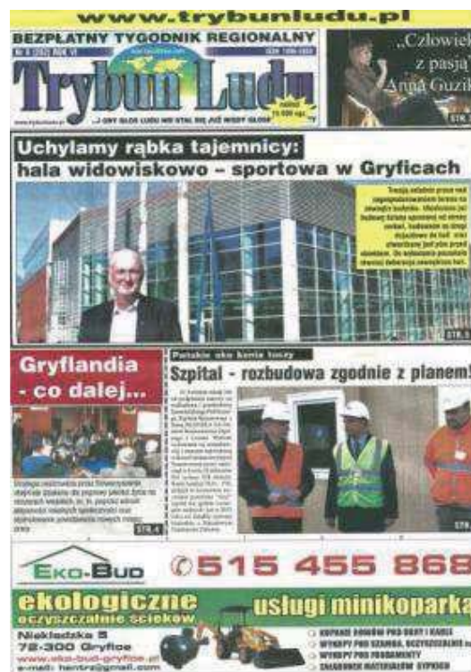
Fot. 2. „Trybun Ludu”. Numer 3 (277) z 2012 roku