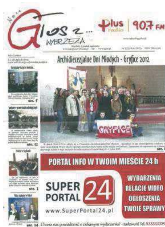
Fot. 7. „Nasz Głos z Wyrzeża. Bezpłatny Tygodnik Regionalny”. Numer 7 (22) z 2012 roku