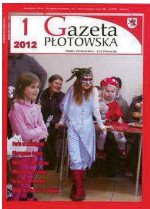
Fot. 17. „Gazeta Płotowska. Pismo Społeczno-Kulturalne”. Numer 4 z 2012 roku