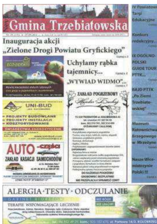
Fot. 6. „Nev Gmina Trzebiatowska”. Numer 25 (145) z 27 kwietnia 2012 roku

Konkurencyjny wobec „Trzebiatowskiej Gazety Regionalnej” jest tytuł „Nev Gmina Trzebiatowska”. Choć obydwie tytuły wydawane są na papierze gazetowym i wzorują się na formie tradycyjnych dzienników, to różnią się formatem wydawniczym, a przede wszystkim strukturą gatunkową pomieszczanych w nich tekstów. O ile „Trzebiatowska Gazeta Regionalna” to tytuł z przewagą gatunków informacyjnych, o tyle „Nev Gmina Trzebiatowska” zawiera zdecydowanie więcej tekstów w gatunkach publicystycznych, starając się zbliżyć do formuły lokalnego tygodnika opinii. Tytuł jest kolportowany odpłatnie – cena egzemplarzowa 2 zł.