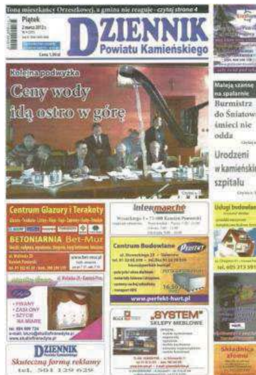
Fot. 1. „Dziennik Powiatu Kamińskiego”. Numer 9 (207) z 2 marca 2012 roku