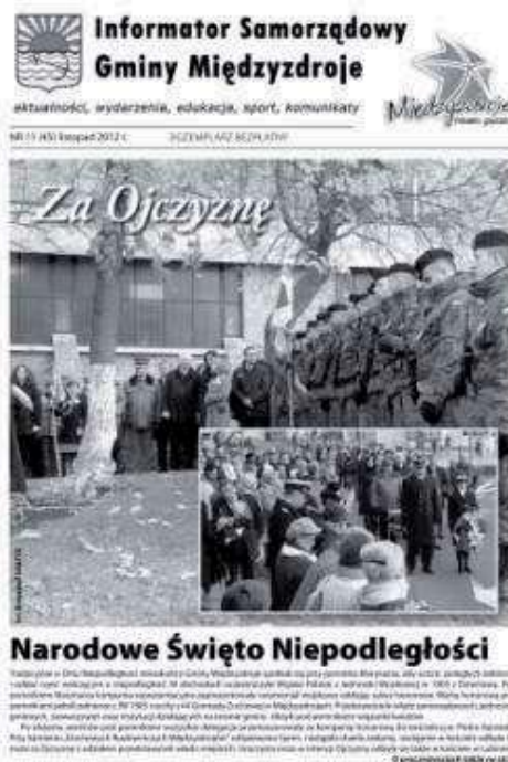
Fot. 13. „Informator Samorządowy Gminy Międzyzdroje”. Numer 11 (45) z 2012 roku