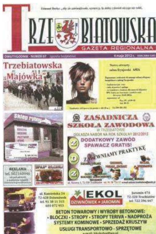
Fot. 5. „Trzebiatowska Gazeta Regionalna”. Numer 07 z 4 maja 2012 roku