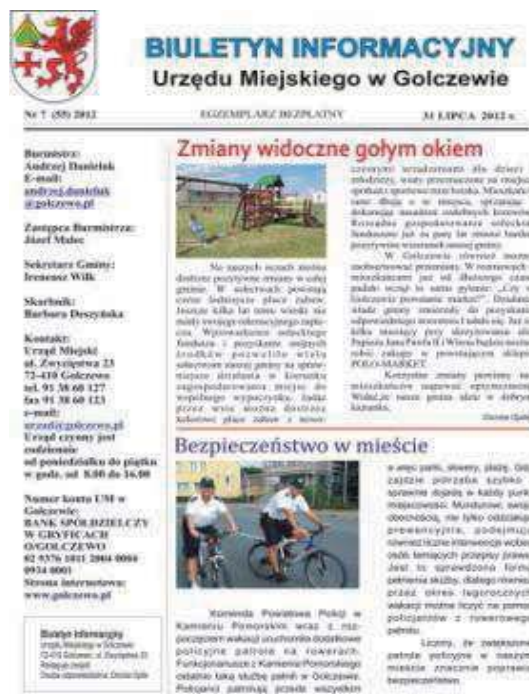
Fot. 14. „Biuletyn Informacyjny Urzędu Miejskiego w Golczewie”. Numer 7 (55) z 2012 roku