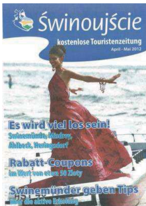
Fot. 19. „Świnoujście. Bezplatna Gazeta Turystyczna”. Numer kwiecień – maj 2012 roku