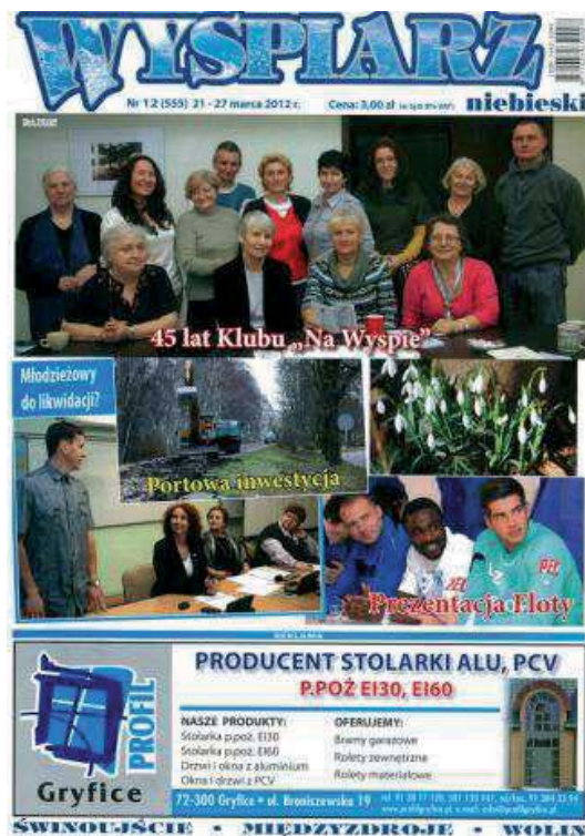
Fot. 8. „Wyspiarz Niebieski”. Numer 12 (555) z 2012 roku