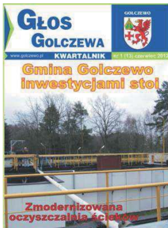
Fot. 15. „Głos Golczewa”. Numer 1 (13) z 2012 roku