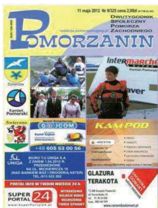
Fot. 16. „Pomorzanin. Dwutygodnik Społeczny Pomorza Zachodniego”. Numer 9/325 z 11 maja 2012 roku