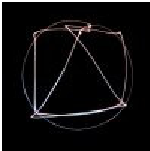
Fotografia 3. Figury geometryczne, Wyróżnienie w V edycji Matematyki w obiektywie www.mwo.usz.edu.pl

W fot. 3 autorstwa Michała Orlińskiego można doszukać się elementów artystycznej twórczości skryzalizowanej prowadzącej do odkrycia własności wielokątów wpisanych w okrąg. Obraz oryginalnie malowany światłem przy długim czasie naświetlenia. Harmonia kształtu, elegancja, ostrożny tytuł zapewniający poprawność.