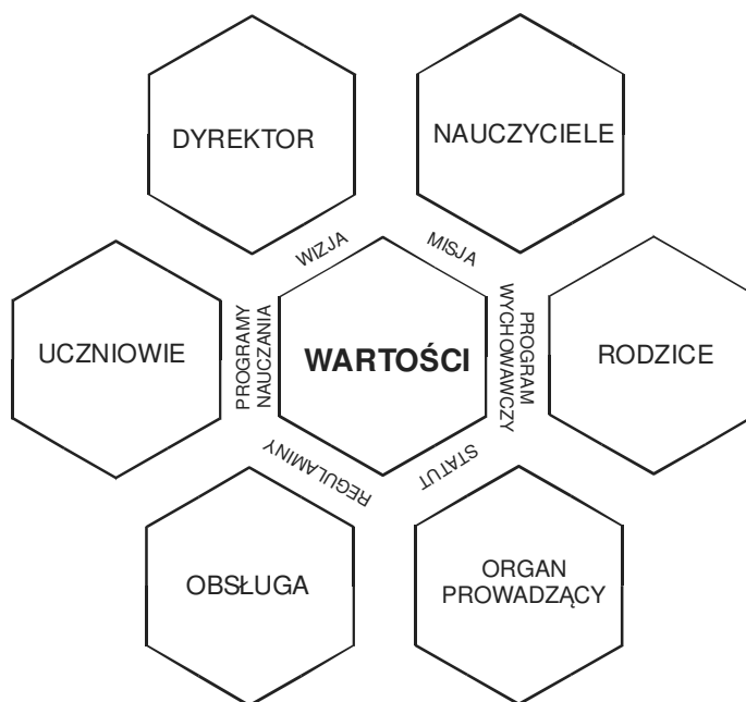
Rysunek 2. System wartości w organizacji szkolnej