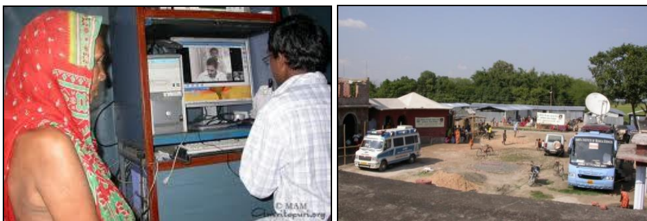
Rys. 1. Pomoc telemedyczna w ramach misji humanitarnej

W działaniach wojskowych w czasie pokoju i wojny telemedycyna przynosi oczywiste korzyści. Każdy nietypowy przypadek chorobowy można skonsultować na odległość z dowolnie wybranym specjalistą 4 . Podobne korzyści przynosi świadczenie usług medycznych drogą elektroniczną w przypadku misji humanitarnych, a trzeba pamiętać o tym, że niejednokrotnie jest to jedyna możliwość udzielenia pomocy miejscowej ludności (rys. 1). Nie można zapomnieć o takich miejscach na ziemi jak wyspy czy bardzo słabo zaludnione obszary, gdzie do potrzebujących pomocy medycznej pacjentów nie można dotrzeć w wystarczająco szybki sposób przy użyciu typowych środków transportu. Zauważmy także pewną grupę pacjentów, których stan zdrowia wymaga ciągłego nadzoru medycznego. Owa konieczność stałego monitorowania stanu zdrowia nie jest równoznaczna z koniecznością hospitalizowania. Wystarczy, by pacjenta wyposażać w odpowiednią interaktywną aparaturę kontrolno-pomiarową, a ta będzie przysyłała wyniki pomiarów do centrum telemedycznego. W razie wystąpienia jakichkolwiek nieprawidłowości związanych ze stanem zdrowia pacjenta automatycznie zostaną powiadomione i wysłane na miejsce odpowiednie służby.