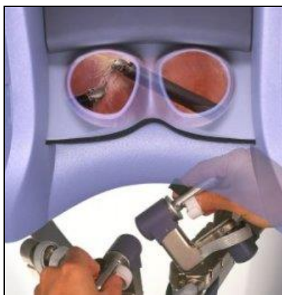
Rys. 2. Wizjer 3D wraz z intuicyjnym manipulatorem robota chirurgicznego da Vinci

(w ograniczonym zakresie) możliwości działania podobnych do tych, jakie się ma realnie uczestnicząc w określonych wydarzeniach zachodzących w istocie w jakimś odległym miejscu” [Tadeusiewicz 2004]. Uzupełnijmy tę wypowiedź słowami W. Ducha: „teleobecność i wirtualna rzeczywistość to nie tylko komunikacja, lecz również kontrolowanie lub sterowanie odległymi procesami i aktywne zdobywanie danych. Przy końcu 1995 roku doniesiono o pierwszych operacjach prowadzonych na odległość przy pomocy wirtualnej rzeczywistości: chirurg z Holandii sterował robotem dokonującym operacji w szpitalu w Brugie, w Belgii” [Duch 1994]. Na tle tego przykładu bardzo wyraźnie zarysowuje się interdyscyplinarność współczesnej telemedycyny. Z jednej strony to nadzwyczaj skomplikowane i ultraprecyzyjne roboty chirurgiczne, które bez wsparcia informatyki nie miałyby szans funkcjonować w obecnej formie, z drugiej strony to nowoczesne technologie informacyjno-komunikacyjne pozwalające na zdalne sterowanie robotem. Przy tym trzeba wyraźnie zaznaczyć, że specyfika telemedycyny wymaga szczególnej dbałości o bezpieczeństwo nie tylko samych baz danych pacjentów, ale nade wszystko musi zapewnić bezpieczeństwo transmisji wszelkiego rodzaju danych, w tym zapewnić bezpieczeństwo sterowania robotem. Najpewniej w tym obszarze najszybciej będzie się rozwijała informatyka, by sprostać wciąż rosnącym wymogom.