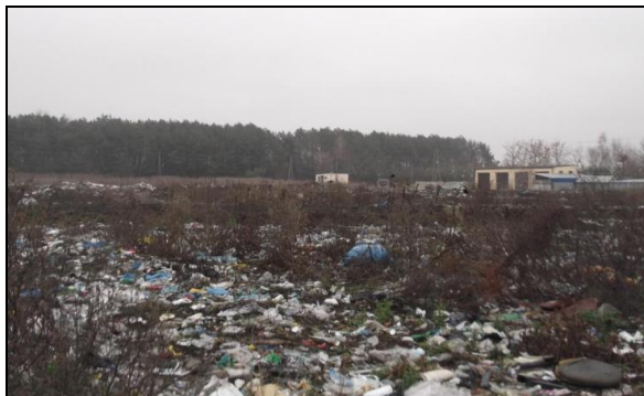
Fot. 2. Składowisko odpadów w miejscowości Nowodwór

Do odpadów komunalnych zaliczane są także odpady pochodzące od innych wytwórców odpadów. Na terenie gminy Lubartów funkcjonuje 9 szkół podstawowych, 2 gimnazja, urzędy oraz Niepubliczny Zakład Opieki Zdrowotnej. Łącznie wytwarzanych jest tam ok. 60 Mg odpadów rocznie. Szacunkowo w sektorze gospodarczym (handel i usługi) powstaje 214 Mg, natomiast w oczyszczalniach ścieków 22 Mg odpadów rocznie. Odpady z oczyszczania ulic oraz z utrzymania zieleni usuwane są wraz z odpadami komunalnymi z gospodarstw domowych (stąd brak ich osobnej ewidencji) [Niedziałkowski i in. 2006].