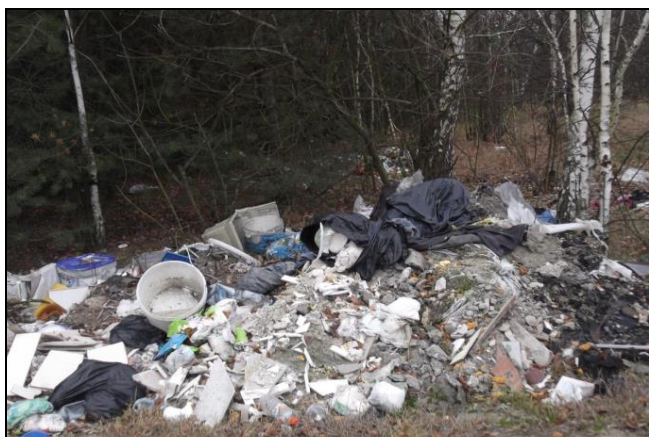
Fot. 3. Dzikie wysypisko odpadów w lesie w miejscowości Lisów