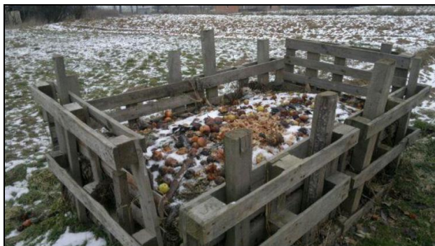
Fot. 1. Przydomowy kompostownik

W gminie nie prowadzi się zbiórki odpadów biodegradowalnych. Wynika to z wiejskiego charakteru gminy – większość odpadów wykorzystywana jest w przydomowych kompostownikach (fot. 1). Trudno ocenić masę odpadów poddawanych kompostowaniu z powodu braku odpowiednich danych.