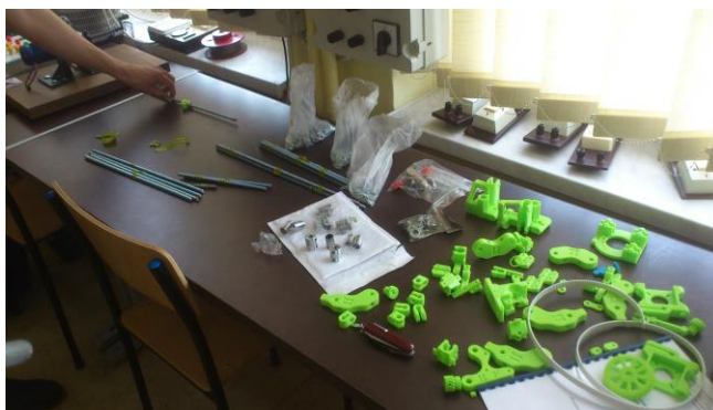
Fot. 1. Elementy potrzebne do złożenia drukarki 3D

Aby rozpocząć budowę, potrzebowaliśmy wydrukowanych na innej drukarce plastikowych elementów ramy, dodatkowych silników krokowych, dyszę ekstrudera, elektronikę sterującą, dodatkowych rezystorów podgrzewających blat roboczy, paski oraz elementy metalowe. Większość wymienionych przedmiotów można zakupić w lokalnych sklepach z materiałami budowlanymi, pozostałych należy szukać u osób, które same tworzą drukarki przestrzenne i chętnie udzielają pomocy.