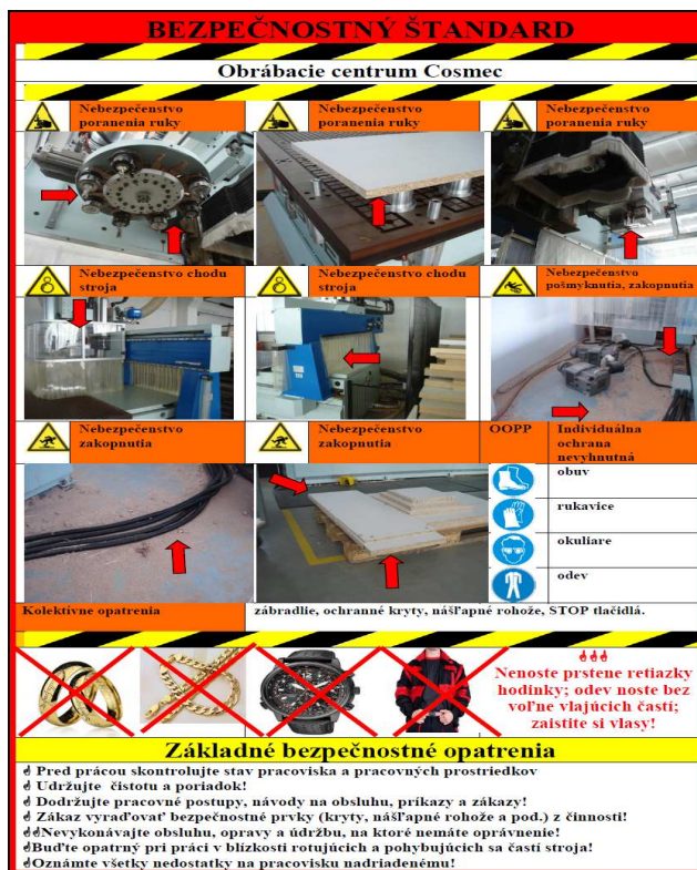
Obrázok 2. Bezpečnostný štandard pre obrábacie centrum Cosmec

Z metódy FMEA vyplynulo, že možnými zdrojmi poškodenia zdravia sú aj neovládanie zásad pri práci na elektrických zariadeniach alebo neznalosť hmotnostných limitov. Tieto nedostatky sa dajú odstrániť pravidelným školením zamestnancov o zásadách BOZP. Prostredie zariadenia je klasifikované ako základné a podľa miery ohrozenia patrí medzi vyhradené technické zariadenia elektrické skupiny B. Tomu zodpovedá pravidelnosť odborných prehliadok a odborných skúšok v zmysle právnych a technických predpisov. Výsledok analýz bol použitý pre tvorbu „Bezpečnostného štandardu pre zariadenie“, ktorého príklad je uvedený na Obrázku 2.