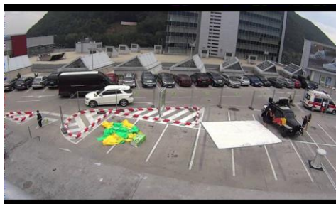
Obr. 2 Outbreak – voľný priestor s pokračovaním do zastrešeného objektu