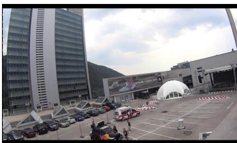
Obr. 3 Outbreak – hlavné vonkajšie pódium