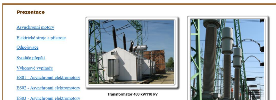
Obr. 3. Ukázka vybrané stránky webového prostředí pro prezentace ( http://projekty.osu.cz/irp2016/prezentace.html )

Dalším postupem pro ovládání multimédia s úložištěm ve webovém prostředí je pro ukázkou spuštění výukových prezentací uvedeno na obrázku 3. Je zde vidět návaznost tlačítka „Prezentace“, které je uvedeno v levé části obrazovky. Po aktivaci tlačítka „Prezentace“ se otevře pro možnost výběru výukových prezentací dle potřeby vyučujícího nebo studenta. Ukázka otevření a orientace v této části multimédia je uvedena na obr. 4. V levé části obr. 3 jsou vyobrazeny názvy výukových prezentací dle tematického zaměření. Je zde vidět, že existují další možnosti doplňování nových prezentací dle potřeby vyučujícího. V článku jsou na ukázkou uvedeny jen dvě vybrané obrazovky, neboť další ovládání multimédia je stejné. Liší se jen materiály a tématem, který zrovna potřebujeme zobrazit.