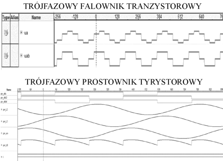
Rysunek 2. Przebiegi zarejestrowane narzędziem SignalTapII modeli falownika (napięcie fazowe i międzyfazowe) i prostownika tyrystorowego (sygnały sterujące, napięcia wejściowe, napięcie i prąd wyjściowe)

Wyłączenie tyrystora następuje zawsze po osiągnięciu przez łącznik wartości mniejszej lub równej prądowi podtrzymania Ioff. Załączenie następuje przy odpowiedniej polaryzacji w chwili pojawienia się impulsu bramkowego. Na podstawie przedstawionych modeli łączników oraz modeli elementów rezystancyjnych i biernych (Anuchin, 2016) (stosując model Eulera) przebadane zostały podstawowe struktury przekształtników energoelektronicznych. Przykładowe wyniki przedstawiono na rysunku 2.