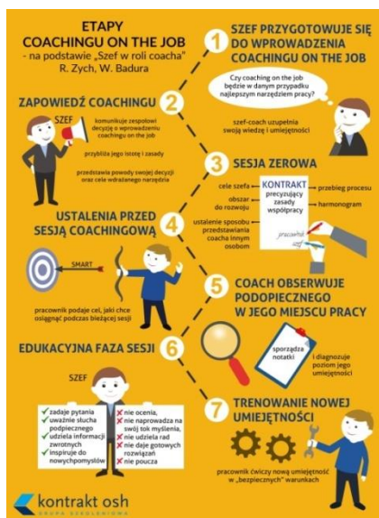
Rysunek 1. Przykład infografiki autorstwa ilustratorki Małgorzaty Zimniak

Źródło: http://gosiazimniak.pl/portfolio-item/infografiki-o-coachingu/ .