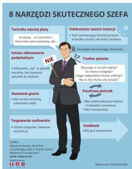
Rysunek 2. Przykład infografiki autorstwa ilustratorki Małgorzaty Zimniak