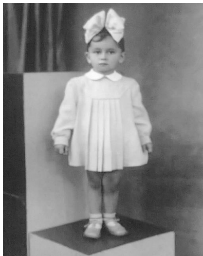
Fot. 9. Wybrane zdjęcie pacjentki

Wersja, w której dysponujemy tylko jednym zdjęciem z okresu wczesnego dzieciństwa skłania do porównań między chwilą bieżącą a momentem, gdy zdjęcie to było wykonywane, sytuacją aktualną a wczesnymi uwarunkowaniami życiowymi. Jest to spojrzenie z perspektywy zderzenia obecnych doświadczeń a wspomnieniami z odległej przeszłości. Ten moment w szczególny sposób identyfikuje istnienie nieświadomego, opartego na wczesnodziecięcych decyzjach i iluzjach, planu życiowego (ang. life-script ). Jak wiadomo, nie można w sposób jednoznaczny ustalić, czy dana osoba znajduje się aktualnie pod wpływem oddziaływania skryptu. Istnieją jednak dwa czynniki, które zwiększają takie prawdopodobieństwo. Jest to: spostrzeganie aktualnej sytuacji jako stresującej oraz prawdopodobieństwo istnienia podobieństwa między obecną sytuacją a zdarzeniami stresującymi mającymi miejsce w dzieciństwie.