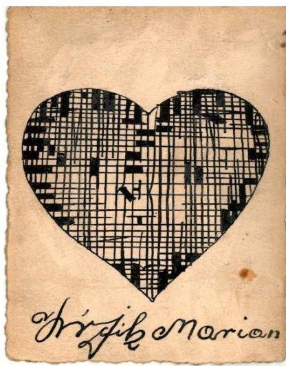
Fot. 11. Odwrotna strona zdjęcia żołnierza