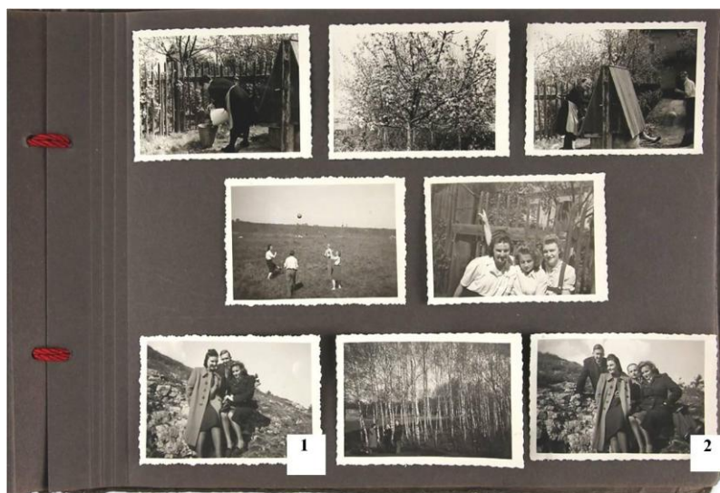
Fot. 8. Porównywanie zdjęć w albumie rodzinnym