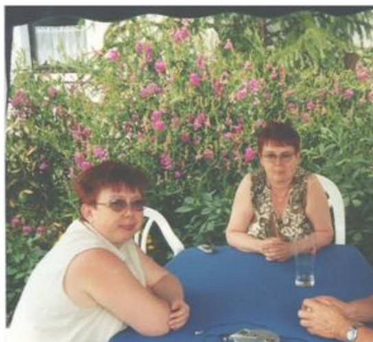
Fot. 3.

Etap porównywania różnych elementów zawartych w albumie rodzinnym rozbudza postawę analityczną i zaciekawia pacjenta. Skłania do pogłębienia badanej rzeczywistości przez poszukiwanie różnic między poszczególnymi elementami zdjęć oraz do prób odpowiedzi na pojawiające się pytania. Pytania wskazujące na dostrzegane podobieństwa i odmienności. Trudno wymienić elementy, które należy ze sobą porównywać, niemniej jednak warto kierować się prostą zasadą mówiącą, iż istotne bywa często to, co wyraźnie zwraca naszą uwagę.