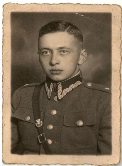
Fot. 10. Zdjęcie żołnierza

Czynnością kończącą budowanie tego rodzaju narracji może być zachęta ze strony terapeuty do napisania listu dorosłej już osoby do przedstawionego na fotografii dziecka. Taki list musi zwracać się jednoznacznie do tego właśnie dziecka (np. Kochana Hanusiu ), ale może też być pisany w formie wskazującej na dorosłą już teraz osobę (np. podpis: Twoja dorosła już czterdziestoletnia Anna ). List może stanowić podstawę do dalszej pracy terapeutycznej w ostatnim etapie redecyzji.