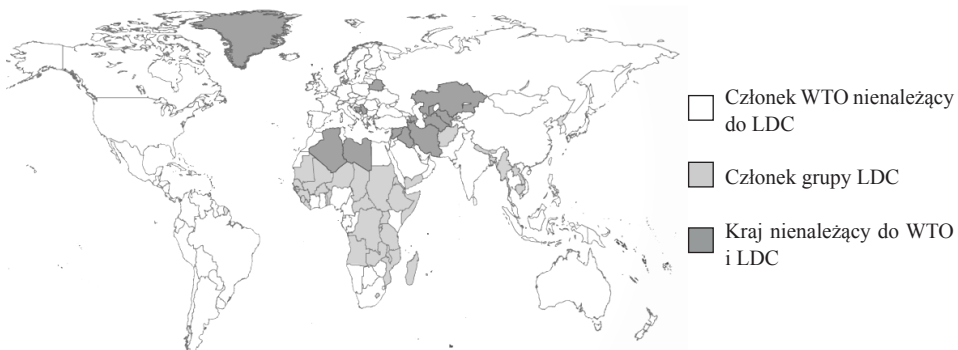
Rysunek 1. Mapa krajów należących do grupy Least Developed Countries (LDC)

W grupie krajów rozwijających się od 1971 r. wyróżnia się państwa o najsłabiej rozwiniętej gospodarce, tzw. LDC ( Least Developed Countries ). Według ONZ jest to najbiedniejsza i najsłabsza grupa w społeczności międzynarodowej. Charakteryzuje się bardzo niskim poziomem rozwoju i mniejszą szansą na przezwyciężenie biedy i wyjście z niej. Komitet ONZ ds. polityki rozwojowej zdefiniował trzy kryteria, na podstawie których dane państwo można zakwalifikować do grupy LDC. Najważniejsze jest kryterium ekonomiczne w postaci średniego dochodu na osobę liczonego na podstawie danych z trzech ostatnich lat (aby kraj został włączony do grupy LDC, przeciętny roczny dochód na osobę powinien być niższy niż 745 USD). Drugą cechą są problemy zasobów ludzkich ( human resource weakness ) mierzone wskaźnikami związanymi z żywieniem, śmiertelnością dzieci do 5. roku życia, edukacją w szkołach ponadpodstawowych czy poziomem analfabetyzmu. Trzecim wyróżnikiem jest słabość i wrażliwość gospodarki mierzona wielkością populacji, dywersyfikacją eksportu, udziałem rolnictwa, rybołówstwa i leśnictwa w gospodarce, stabilnością produkcji rolnej, eksportu dóbr i usług oraz poziomem bezdomności powstałej na skutek klęsk żywiołowych (UN-OHRLLS 2009).