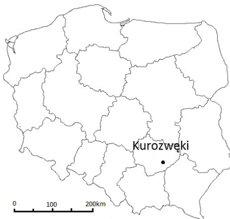
Rysunek 1. Położenie obszaru badań na tle mapy konturowej Polski z podziałem administracyjnym na województwa

Badaniami ankietowanymi objęto turystów odwiedzających Zespół Pałacowy w Kurozwękach. Miejscowość, w której znajduje się ten obiekt, jest zlokalizowana w południowo-wschodniej części województwa świętokrzyskiego (rys. 1). Miejsce to do niedawna nie wzbudzało zainteresowania turystów, obecnie zaś Kurozwęki stają się atrakcją o ponadregionalnym znaczeniu (Zieliński, 2012b) i są chętnie odwiedzane przez dziesiątki tysięcy turystów (rys. 2) z różnych zakątków Polski (rys. 3). Kurozwęki swój sukces turystyczny zawdzięczają pałacowi, który powrócił w ręce spadkobierców i przeszedł generalny remont, a otaczający go park odzyskał urok. W odrestaurowanej posiadłości stworzono szereg inwestycji, na bazie których powstał Zespół Pałacowy. Warto jeszcze podkreślić, że w ostatnich latach większego znaczenia w turystyce nabierają także inne obszary zlokalizowane