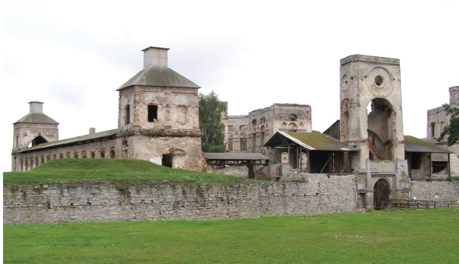
Fotografia 2. Zamek Krzyżtopór w Ujeździe