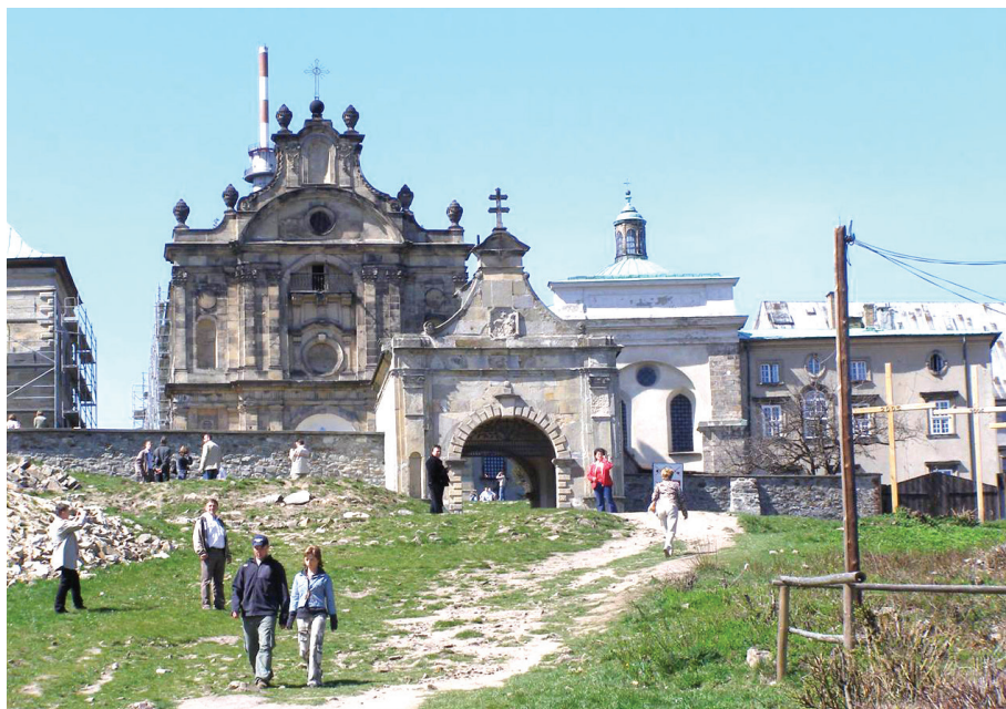
Fotografia 1. Klasztor na Świętym Krzyżu

wierzę kościelną, która jest doskonałym punktem widokowym na rozległą i niezwykle malowniczą okolicę. Ponadto, w obrębie Gór Świętokrzyskich turyści za znaczące atrakcje uważają: Św. Katarzynę, Nową Słupię oraz najwyższy punkt Łysogór – Górę Łysicę, której wysokość sięga 612 m n.p.m. i jednocześnie jest najwyższym położonym punktem w całym pasie Wyżyn Środkowopolskich. Zainteresowaniem turystów cieszy się także niewielkie miasteczko Bodzentyn, leżące u północnego podnóża Gór Świętokrzyskich oraz osobliwości przyrodnicze gór, a w szczególności gołoborza. Stanowią je swoiste pokrywy stokowe, składające się z lekko redeponowanego rumoszu skalnego. Swe powstanie zawdzięczają procesom mrozowym, a w szczególności zamarzaniu i rozmarzaniu podłoża, które doprowadziło do rozpadu blokowego skał.