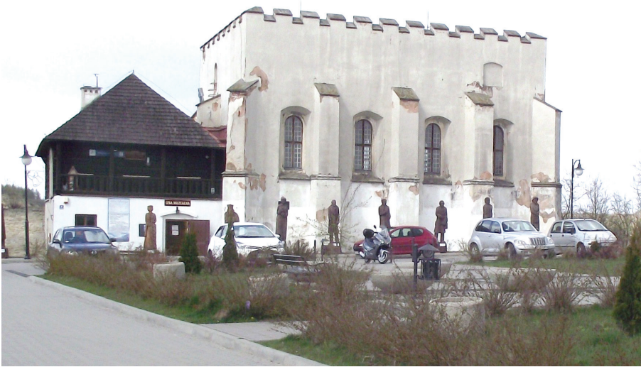
Fotografia 4. Synagoga w Szydłowie

Poza tym za miejsca bardzo interesujące w regionie świętokrzyskim ankietowani uznali jeszcze Sandomierz. Zainteresowanie Sandomierzem szczególnie wzrosło po emisji popularnego serialu telewizyjnego Ojciec Mateusz , którego akcja rozgrywa się właśnie w tym mieście. W dalszej kolejności turyści wskazywali Pacanów, bowiem w miejscowości tej funkcjonuje od kilku lat Europejskie Centrum Bajki im. Koziołka Matołka, a poza tym samo miasteczko zaczyna być uważane za polską stolicę bajek.