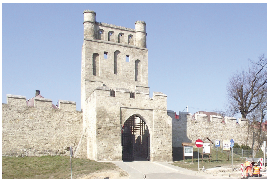
Fotografia 3. Brama Krakowska w Szydłowie