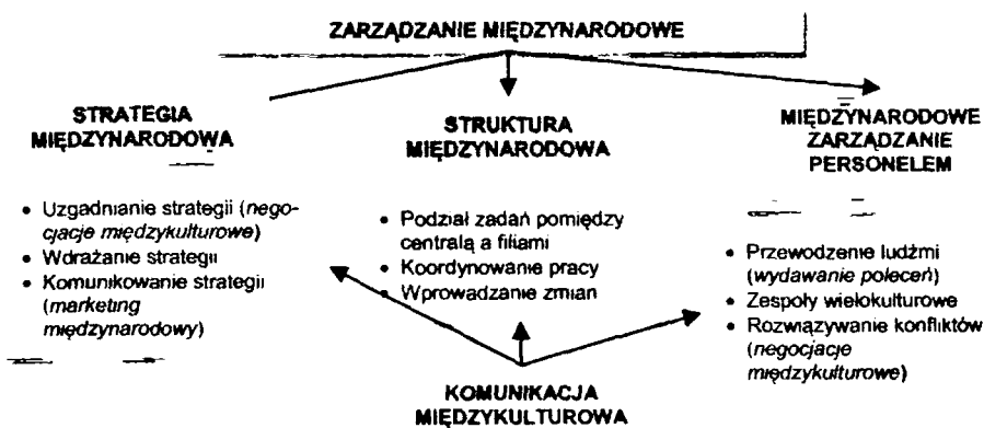
Rysunek 2. Zarządzanie międzynarodowe a komunikacja międzykulturowa. Źródło: opracowanie własne.

KTN jest model organizacji transnarodowej, w którym filiom zagranicznym przypisuje się zróżnicowane role w zależności od posiadanych kompetencji i potrzeb KTN, a strategia przedsiębiorstwa oparta jest na próbie łączenia efektów skali i dostosowań lokalnych 7 . W tym przypadku KTN kierując się złożonymi motywami inwestycyjnymi kieruje się na rynki także odległe w sensie kulturowym, w wyniku czego napotyka na szereg barier komunikacji międzykulturowej. Zarządzanie międzynarodowe, które jest udziałem przedsiębiorstw angażujących się w biznes międzynarodowy, w tym KTN, koncentruje się na trzech głównych problemach: opracowaniu i realizacji efektywnej strategii międzynarodowej, doborze właściwej struktury organizacyjnej dla operacji międzynarodowych oraz zarządzaniu ludźmi w otoczeniu wielokulturowym 8 . Każdy z tych obszarów wiąże się z komunikowaniem międzykulturowym, przy czym najsilniej komunikowanie uwidacznia się w obszarze stosunków międzyludzkich, a więc międzynarodowym zarządzaniu personelem (rysunek 2).