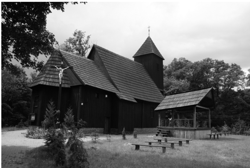
Rys. 2. Kościół Świętego Idziego w Chelstowie Wielkim

głównymi z początku XVIII wieku, w Zalesiu z ludową polichromią stropu nawy i prezbiterium z 1720 roku, w Międzygórzu z barokowym ołtarzem głównym z 1740 roku, w Kamieńczyku z barokową polichromią empor i chóru z 1743 roku, w Kuźniczysku z niszczącymi emporami z 1764 roku, w Złotowie z barokowym ołtarzem głównym i amboną z 2 połowy XVIII wieku i w Grabownie Małym z całym dziewiętnastowiecznym neogotyckim wyposażeniem.