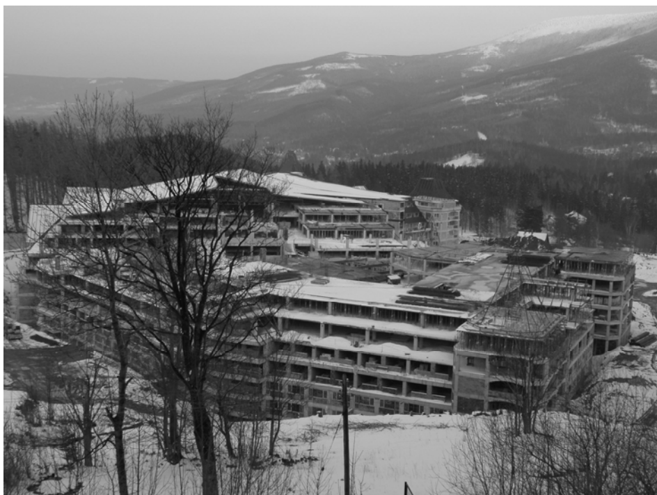
Rys. 1. Kompleks Gołębiewski w Karpaczu

Tak potężne zespoły kubaturowe zlokalizowane na dziewiczych terenach górskich mogą negatywnie wpłynąć na zmiany krajobrazowe, na przemiany w funkcjonowaniu poszczególnych stref w mieście, na liczne komponenty środowiska, nie tylko na terenie obu tych kompleksów, ale także w bliższym i dalszym sąsiedztwie.