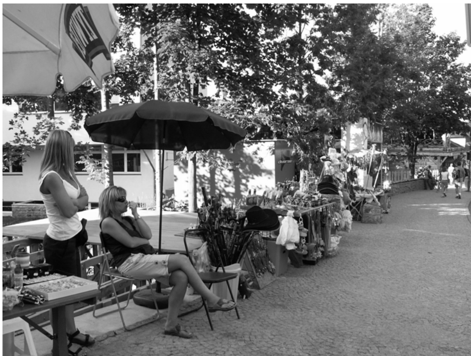
Rys. 3. Stragany obsługujące turystów i kuracjuszy

Urządzone z przepychem i gustem hotelowe restauracje poza sezonem wynajmowane są na imprezy okolicznościowe typu komunie, wesela, imieniny oraz konferencje. W pełni sezonu letniego i zimowego, w okresach urlopowych liczne są stragany obsługujące turystów i kuracjuszy.