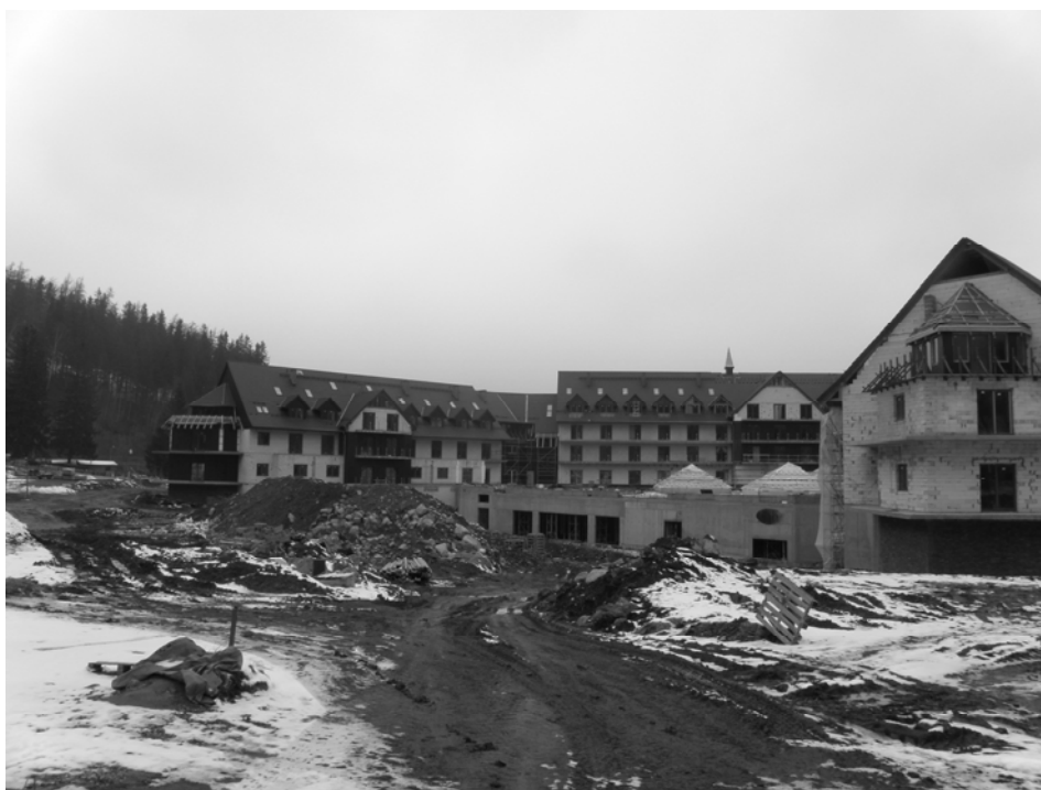
Rys. 2. Centrum Rehabilitacyjno-Sanatoryjne „Sandra”

Obecnie Karpacz odwiedzany jest rocznie przez około miliona turystów. Nowe kompleksy konferencyjno-wypoczynkowe przyciągną do miasta każdego roku dodatkowo 300 tys. turystów. Każdy przyjeżdżający do Karpacza będzie wiedział, że jeśli nawet nie trafi na dobrą pogodę, będzie miał dziesiątki innych atrakcji, dzięki którym spędzi tu ciekawie czas.