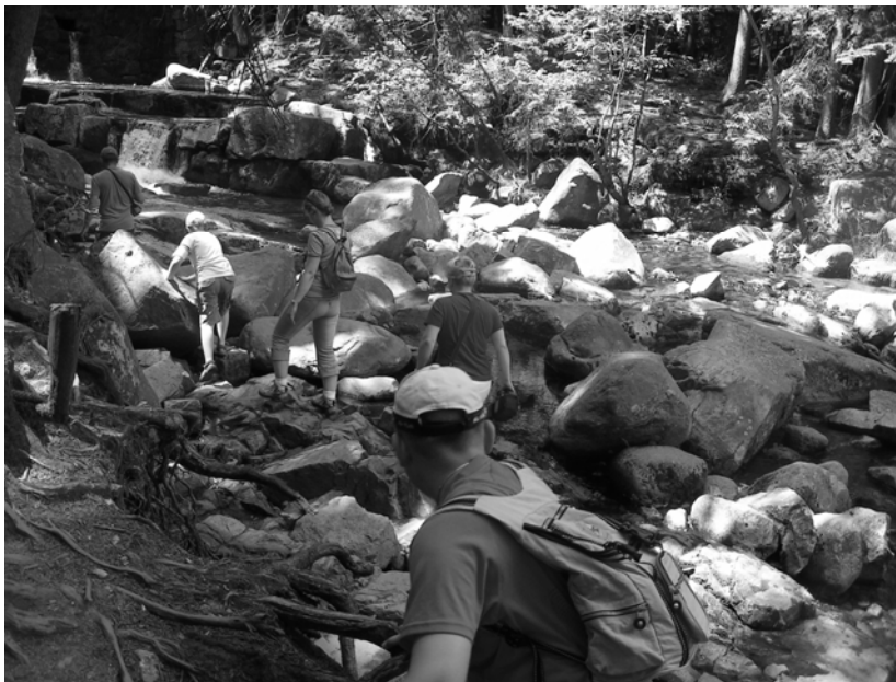
Rys. 4. Dziki Wodospad