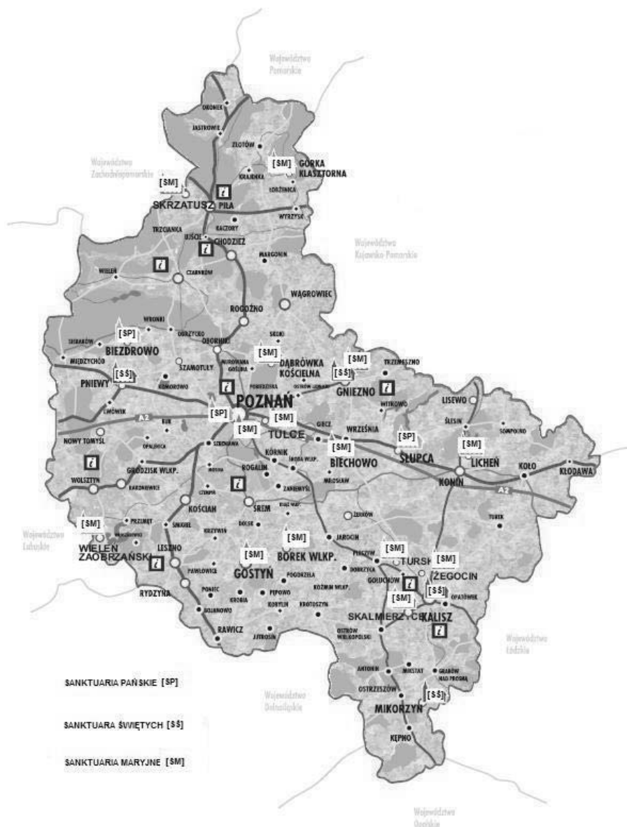
Rys. 2. Mapa miejsc pielgrzymkowych w Wielkopolsce

Przestrzenne rozmieszczenie wybranych wielkopolskich sanktuariów przestawiono na rysunku 2.