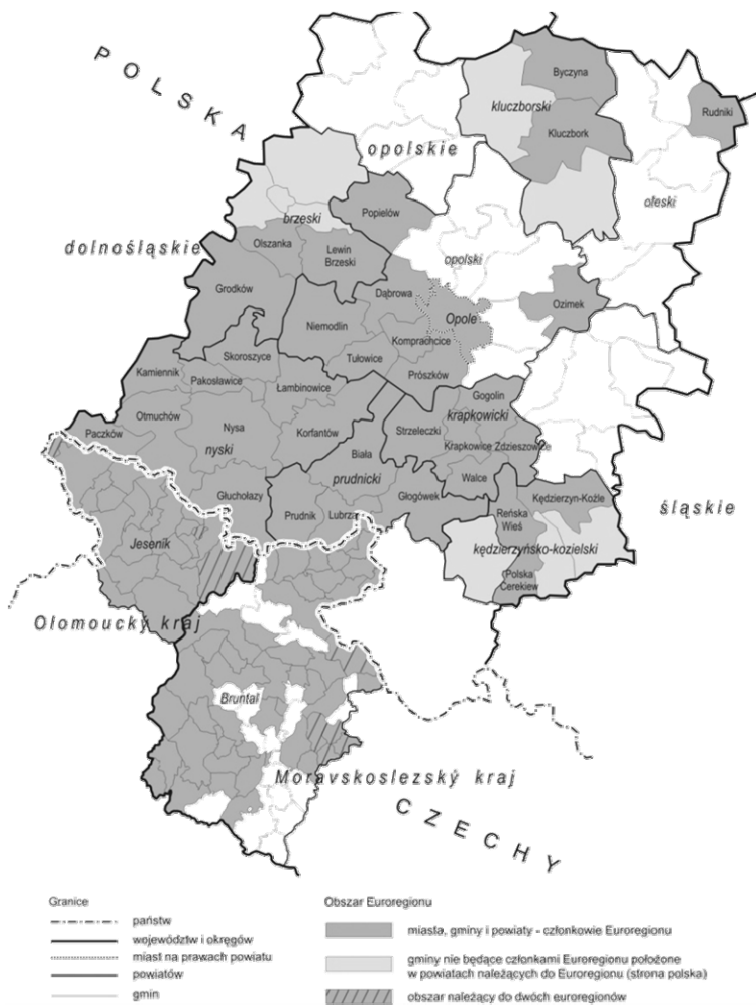
Rys. 1. Euroregion Pradziad wraz z gminami członkowskimi według stanu na dzień 31 grudnia 2009 roku