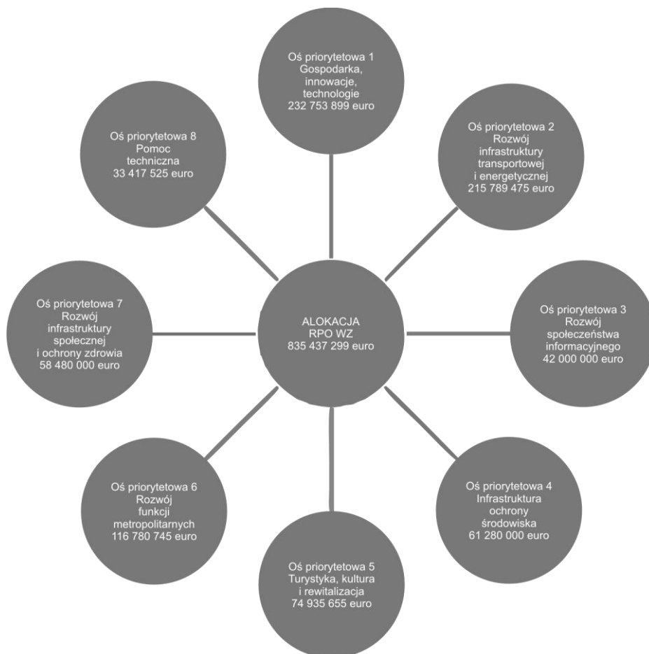
Rys. 1. Alokacja RPO WZ w podziale na osie priorytetowe