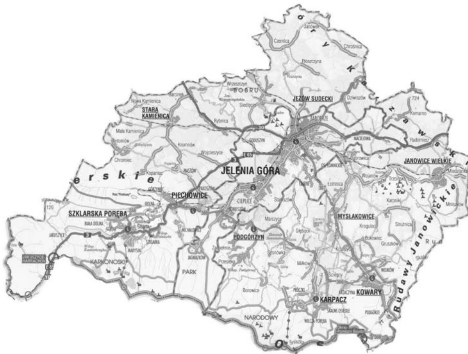
Mapa 1. Powiat jeleniogórski

2003]. Powiat zamieszkuje 64 157 mieszkańców. Gęstość zaludnienia wynosi 99 osób na km 2 [Plan rozwoju..., 2004].