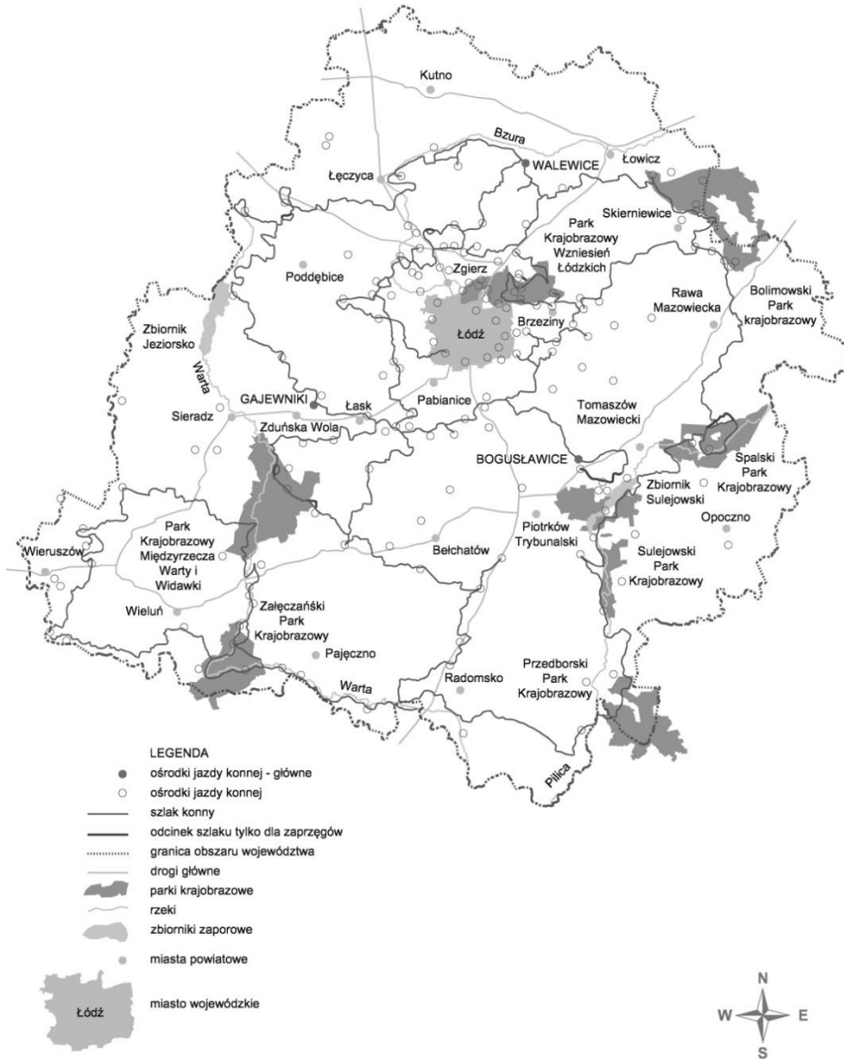
Rys. 2. Schemat przebiegu Łódzkiego Szlaku Konnego i rozmieszczenie ośrodków jazdy konnej