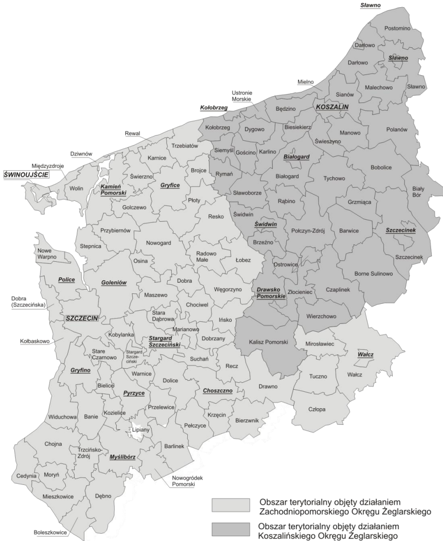
Rys. 1. Podział terytorialny województwa zachodniopomorskiego na obszary działania ZOZZ i KOZZ