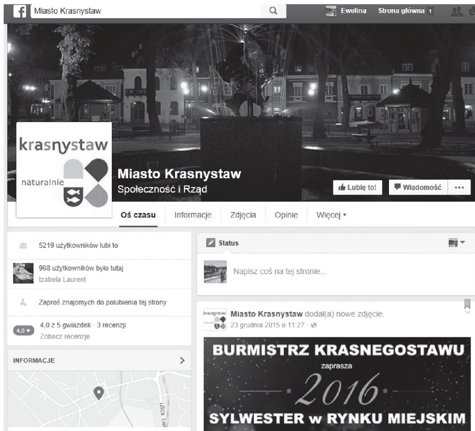
Rys. 1. Profil miasta Krasnystaw na Facebooku