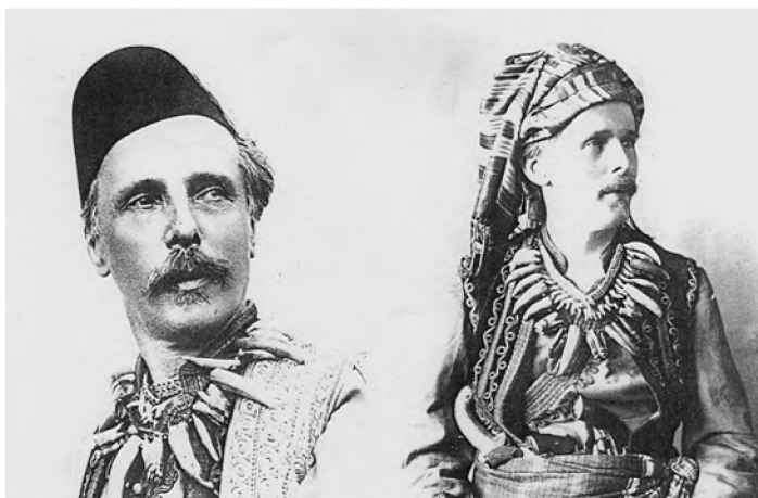
Rys. 3 Karol May jako Kara Ben Nemzi