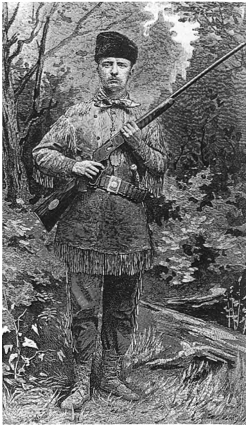
Rys. 6 Theodore Roosevelt; ilustracja z Hunting Trips of a Ranchman (1885)