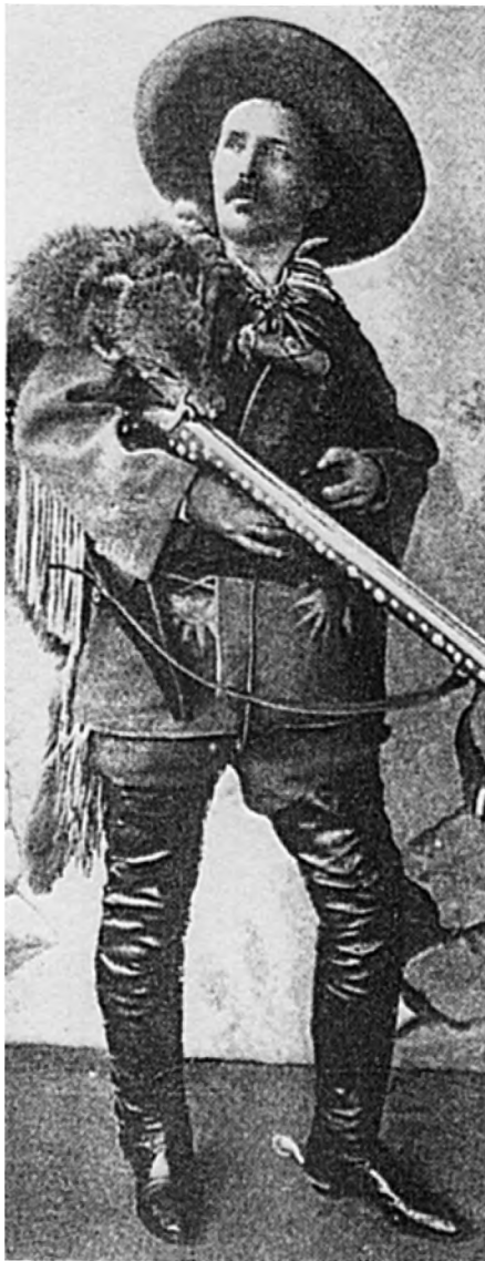
Rys. 7 Karol May; ilustracja z tomu XIX Freiburger Reiche (1902)