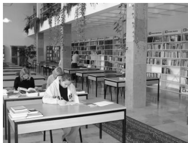
duża i przestronna czytelnia

Biblioteka należy do Federacji Bibliotek Kościelnych „FIDES”, powołanej do życia w 1995 r. Jej dyrektor jest członkiem Zarządu Federacji „FIDES”. Biblioteka korzysta z oprogramowania MAK (współtworzonego przez Bibliotekę Narodową i Federację „FIDES”). Opracowywane są katalogi komputerowe dostępne on-line ( http://www.hosianum.edu.pl ).