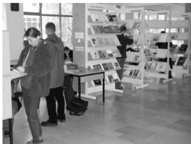
czytelnia czasopism bieżących

Biblioteka zajmuje powierzchnię 1 966 m 2 . Ma dużą czytelnię z 82 miejscami. Oprócz dyrektora w bibliotece pracują 3 osoby na pełnych etatach.