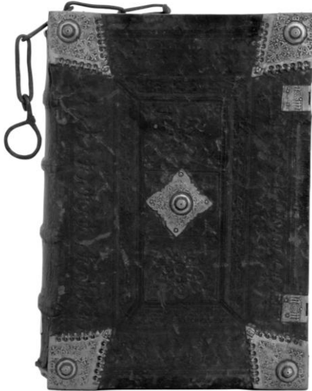
Księga łańcuchowa, inkunabuł z 1480 r.

Sporych nakładów wymagały oprawy książek. Książki często kupowano w stanie surowym i oprawiano je we własnym zakresie. To było tańsze niż kupno już oprawionych. Dodatkowo jezuitom umożliwiał to wytłoczenie na oprawie wzorów czy superekslibrisów zgodnych z ich upodobaniem. Niektóre z ksiąg posiadały wyszukane oprawy artystyczne z wytłokami, które dla badaczy dziejów introliigatorstwa stanowią interesujący przedmiot badań naukowych 18 .