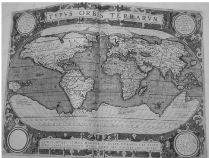
Abraham Ortelius: Theatrum Orbis Terrarum z 1592 r. (mapa świata)

teki Uniwersytetu Jagiellońskiego 14 . Następni biskupi też tylko w nieznaczny sposób zasilili księgozbiór jezuicki. O losach księgozbioru Kromera niewiele wiadomo. Sporą bibliotekę pozostawił Andrzej Batory, ale została ona wykupiona częściowo przez biskupa Szymona Rudnickiego i przez księgarza gdańskiego Jana Krausa, reszta zaś została sprzedana na aukcji na pokrycie długów zmarłego. O bibliotece Szymona Rudnickiego i Jana Olbrachta Wazy też niewiele wiadomo, natomiast sporo książek z biblioteki Mikołaja Szyszkowskiego dotarło do księgozbioru jezuickiego, np. cenne dzieła Salmerona i Suareza otrzymało kolegium reszelskie. Tak więc kolegium braniewskie po biskupach warmińskich nie odziedziczyło większej ilości książek 15 .