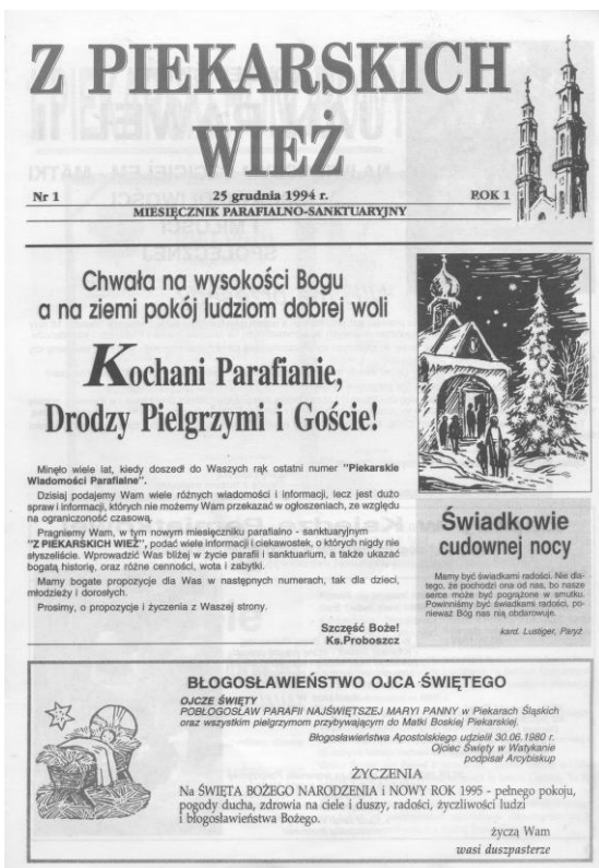
Rys. 1. Strona tytułowa miesięcznika parafialno-sanktuaryjnego Z Piekarskich Wież Nr 1 (Rok 1) z 25 grudnia 1994 r.