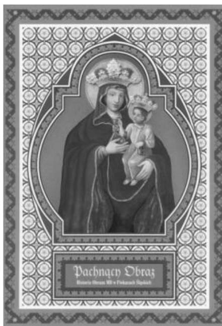
Rys. 4. Okładka przednia, strona zewnętrzna publikacji Pachnący obraz. Historia obrazu MB w Piekarach Śląskich . Oprac. ks. A. Pyrsz na podstawie książki ks. J.

W roku Jubileuszu, pierwszy raz w historii Sanktuarium, zostały wybite przez Mennicę Śląską dwie okazjonalne monety o limitowanym nakładzie, odlano okolicznościowy medal przedstawiający Matkę Bożą Piekarską, wykonano dużą świecę jubileuszową, wydano znaczki pocztowe oraz pamiątkową pocztówkę 18 .