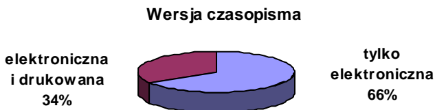
Wykres 2. Wersja czasopisma

Zdecydowaną większość stanowią czasopisma wyłącznie elektroniczne w liczbie 39 tytułów (66 %). Równoległą postacią drukowaną posiada 20 periodyków (34 %). Biorąc pod uwagę kraj wydania widać ogromne zróżnicowanie tej ostatniej grupy: Brazylia (3), Izrael (2), Niemcy (2), Stany Zjednoczone (2), Australia (1), Chile (1), Chorwacja (1), Japonia (1), Litwa (1), Norwegia (1), Polska (1), Portugalia (1), Szwajcaria (1), Wielka Brytania (1), Włochy (1).