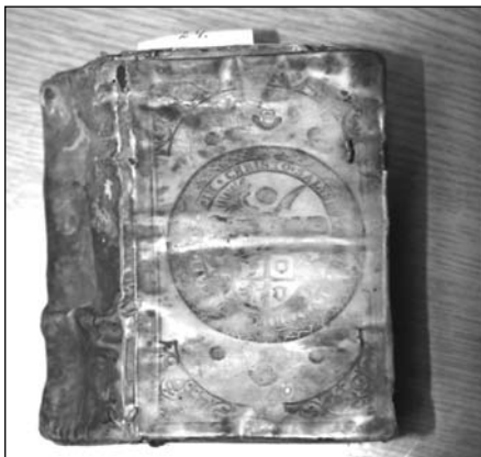
Fot. 2. Brak wiązań, skurczenie i ślady po żerowaniu owadów, rozwarstwienie oprawy, pofalowanie oprawy pergaminowej