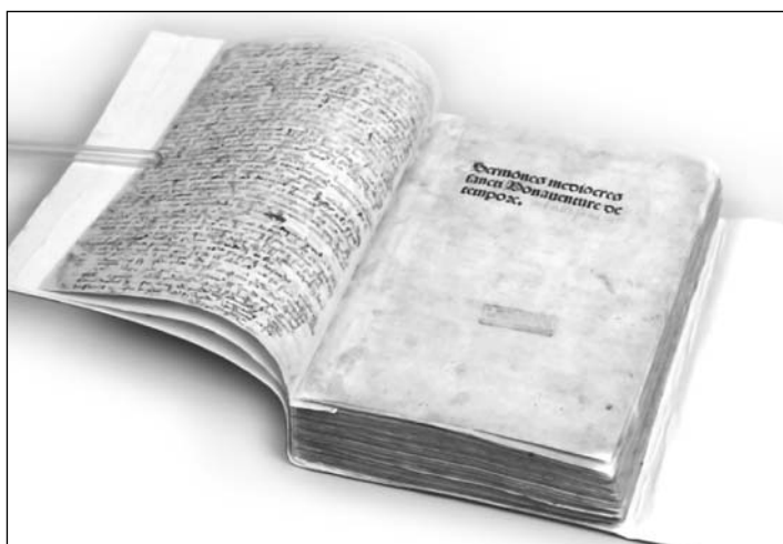
Fot. 19 i 20. Efekty czyszczenia kart, uzupełnienia ubytków oraz prasowania bloku