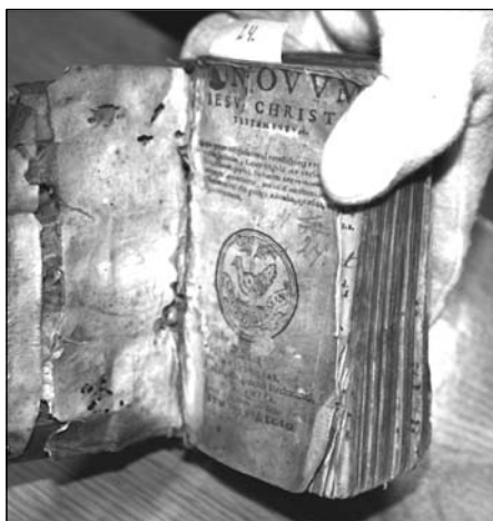
Fot. 1. Zabrudzenia oraz ściemnienie kart

Z ubolewaniem należy stwierdzić, że mimo przechowywania kolekcji zgodnie z zaleceniami 8 dla zabytkowych księgozbiorów całość była bardzo zakurzona, z widocznymi śladami pleśni oraz ubytkami i tunelami wydrążonymi przez żerujące owady i gryzonie. Należy przypuszczać, że zbiór został zainfekowany przed przenosinami do magazynu lub przez kontakt z porażonymi woluminami. Nie mniej liczne były uszkodzenia mechaniczne książek: rozdarcia kart, rozwarstwienia struktury okładek, pęknięcia opraw w narożnikach i na grzbietach, uszkodzenia łączenia bloku z oprawą, niekiedy całkowite oberwanie oprawy. Zniszczenie oprawy ksiąg poprzez oberwanie zapinek metalowych lub wiązań spowodowało dodatkowo naruszenie struktury bloku książki. Zniszczenia chemiczne, jakie zaobserwowano w kolekcji, to plamy atramentu pieczęci lub zapisków rękopiśmiennych, foxing 9 oraz ślady korozji metalowych części zapinek i zdobień. Stan zachowania całości kolekcji ukazują poniższe fotografie.