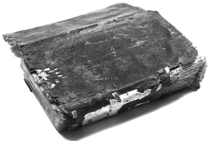
Fot. 15 i 16. Stan zachowania oprawy