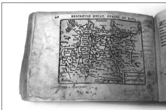
Fot. 10 i 11. Podklejenia kart