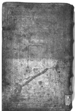
Fot. 6 i 7. Efekty czyszczenia skór