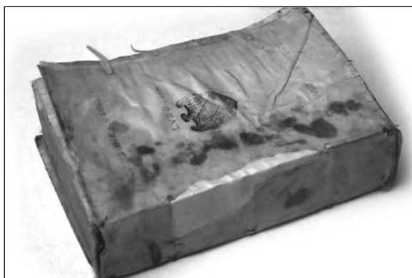
Fot. 12. Uzupełnienie ubytków skóry na grzbiecie