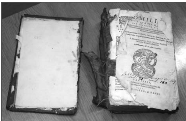
Fot. 4. Oberwana okładzina górna