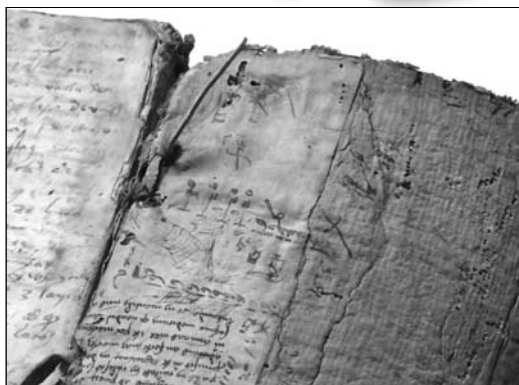
Fot. 17 i 18. Stan zachowania wnętrza książki