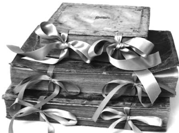
Fot. 13 i 14. Księgozbiór po konserwacji zachowawczej

Interwencja konserwatora dotycząca opisywanej kolekcji ograniczała się do napraw w tych przypadkach, gdy pozostawienie książki bez podjęcia żadnych kroków prowadziłoby do jej dalszej degradacji: dalszego deformowania bloku, wypadnięcia kart i w konsekwencji do utraty części treści książki. W przypadku ksiąg o dużym stopniu zniszczenia zastosowano dodatkowo pudła ochronne. Przy stosunkowo niewielkim nakładzie finansowym udało się zabezpieczyć kilkadziesiąt ksiązek, co – jak podkreśla-