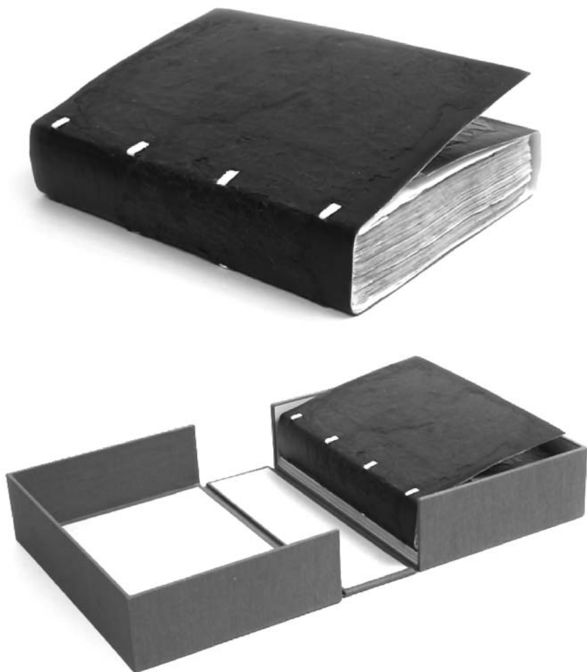
Fot. 21 i 22. Efekt końcowy konserwacji

Do rekonstrukcji oprawy użyto pozostałości skóry z oryginalnego egzemplarza oraz nowej skóry, obie warstwy scalono klejem. Przygotowaną oprawę uelastyczniono oraz poddano działaniu zabezpieczającemu balsamu i wosku. Okładkę połączono z blokiem książki. Całość jest przechowywana w ochronnym pudle z kieszeniami na wyklejki.