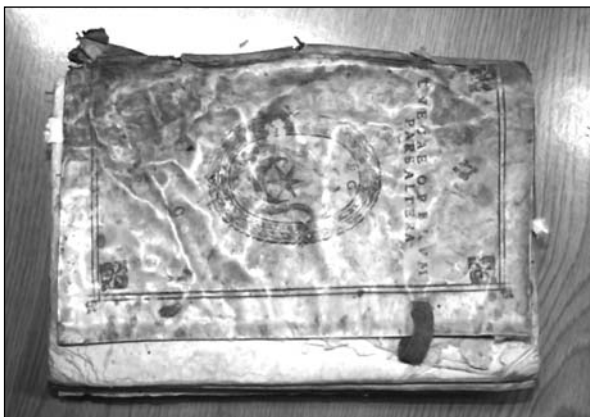
Fot. 5. Brak wiązań, pofalowanie pergaminu

Program prac konserwatorskich objął inwentaryzację oraz prace profilaktyczne nad całością zbioru. Konserwację rozpoczęto od usunięcia zabrudzeń oraz pudrowych nalotów pleśni, a także innych zanieczyszczeń (fragmenty papieru, ślady działalności owadów w postaci pudru i odchodów wysypujących się z tuneli wydrążanych przez chrząszcze). Prace te wykonano za pomocą odkurzacza z filtrem HEPA. Dokładne czyszczenie zabrudzeń wykonano przy użyciu pędzli i gum konserwatorskich, a w przypadku skór i pergaminu – emulsji konserwatorskich.