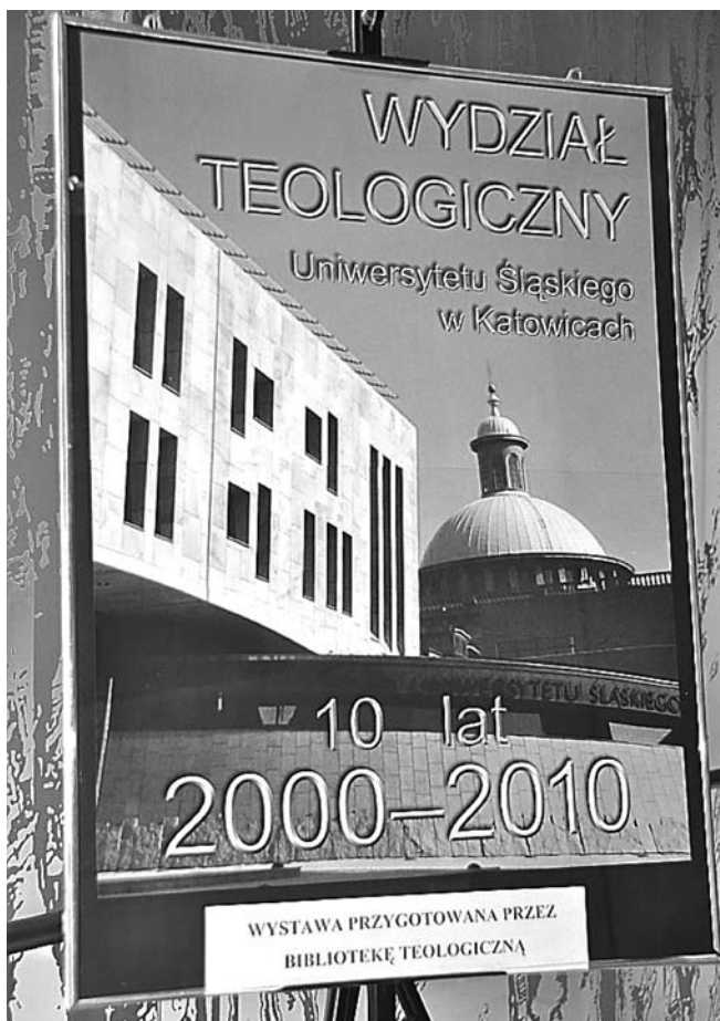
Plakat – Dziesięciolecie Wydziału Teologicznego w Katowicach

Ogromną wartość posiadają również wszelkie dokumenty na temat Biblioteki Teologicznej, zwane dokumentami chwili, o charakterze praktycznym lub okazjonalnym. Jest to zazwyczaj materiał, który stanowi jedyny ślad działalności instytucji, sygnał o danym wydarzeniu, odbywającej się imprezie itp. Występuje w postaci druków ulotnych, wydawnictw zwartych i ciągłych. Są to plakaty, katalogi wystaw, targów, zaproszenia i inne.