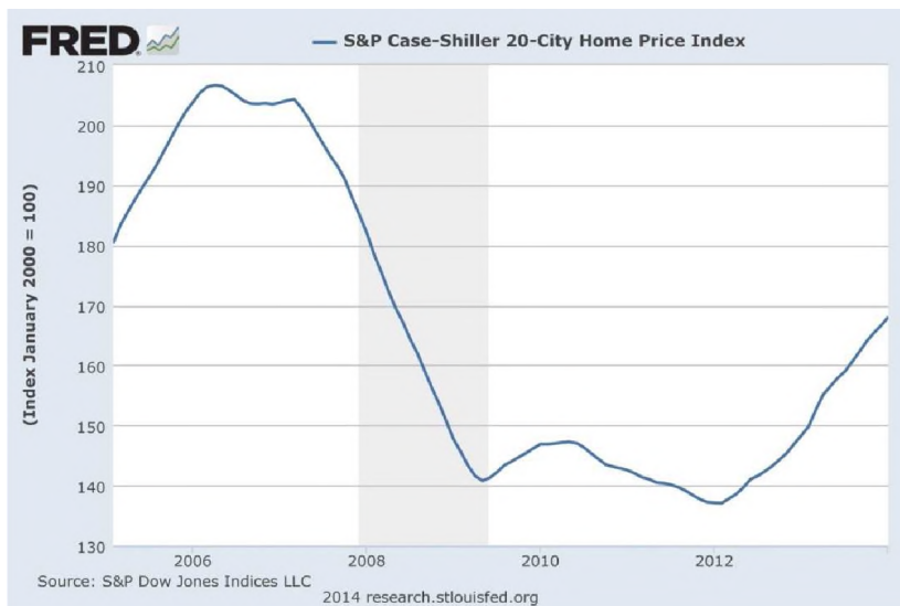
Wykres 6. Indeks cen domów w USA od 2005 do 2014 r.