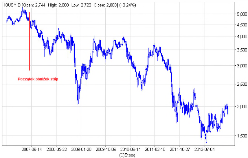
Wykres 3. Rentowności 10-letnich obligacji USA między 2007 a 2013 r.

wielu ekonomistów krytykuje ówczesne działania FED [Taylor 2010: 50–51], stawiając zarzut, że ich skutkiem była gwałtowna spekulacja na rynku surowców (ropa podrożała do lipca 2008 r. o 100%).