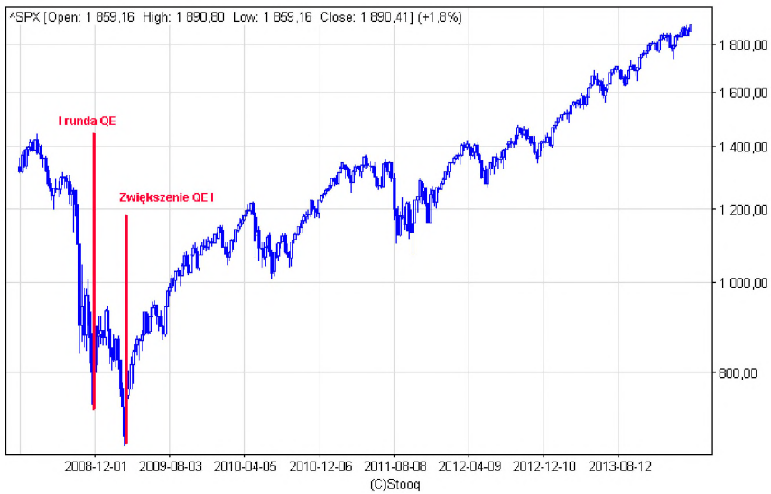
Wykres 5. Indeks S&P 500 w latach 2008–2014