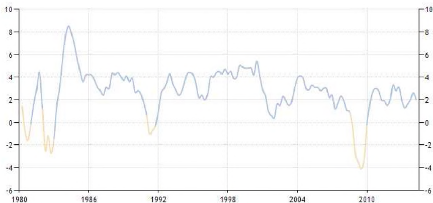
Wykres 1. Roczne tempo wzrostu PKB w USA w latach 1980–2014

a także pokrywa się z cyklem Juglara. W latach 80. i 90. dokonała się rewolucja informatyczna i doszło do procesów globalizacji na szeroką skalę. Można założyć, że pierwsze dwa cykle (w dużej mierze zgodnie z teorią realnego cyklu koniunkturalnego [Kydland i Prescott 1982]) wynikały głównie z tych przyczyn. Natomiast ostatni cykl był efektem przede wszystkim ekspansji monetarnej, bańki na rynku nieruchomości (diagnoza austriackiej szkoły cykli koniunkturalnych). Stąd też załamanie jakie nastąpiło w latach 2007–2009 było dużo głębsze niż poprzednie.