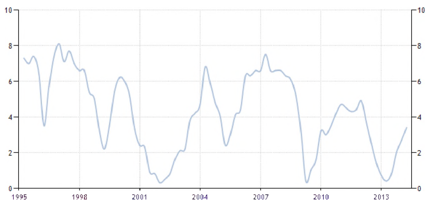
Wykres 2. Roczne tempo wzrostu PKB w Polsce w latach 1995–2014