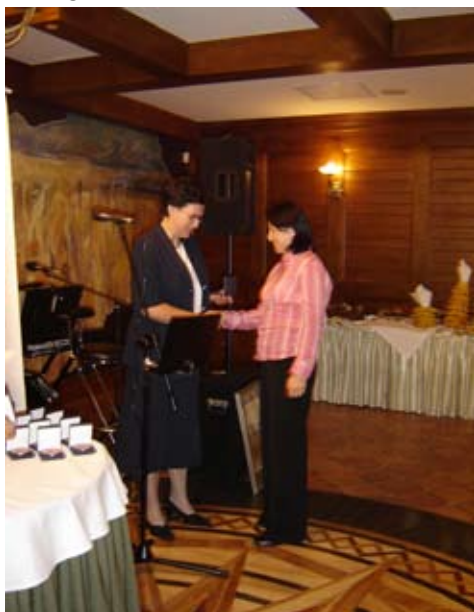
Mgr Beata Bator, Kraków