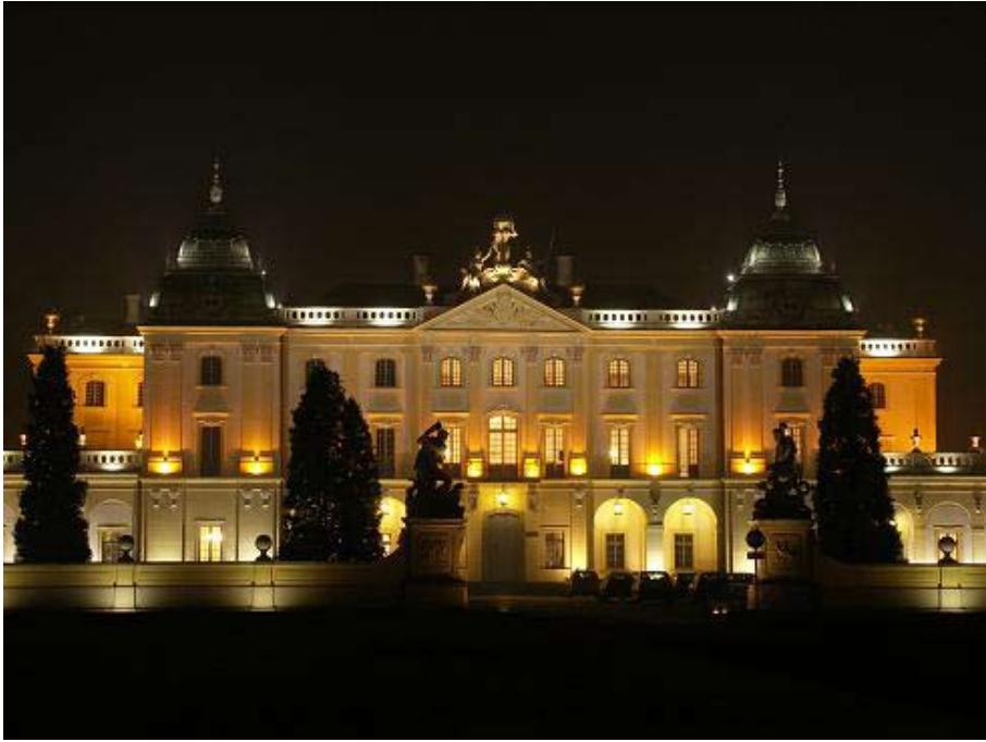
Pałac Branickich, Białystok