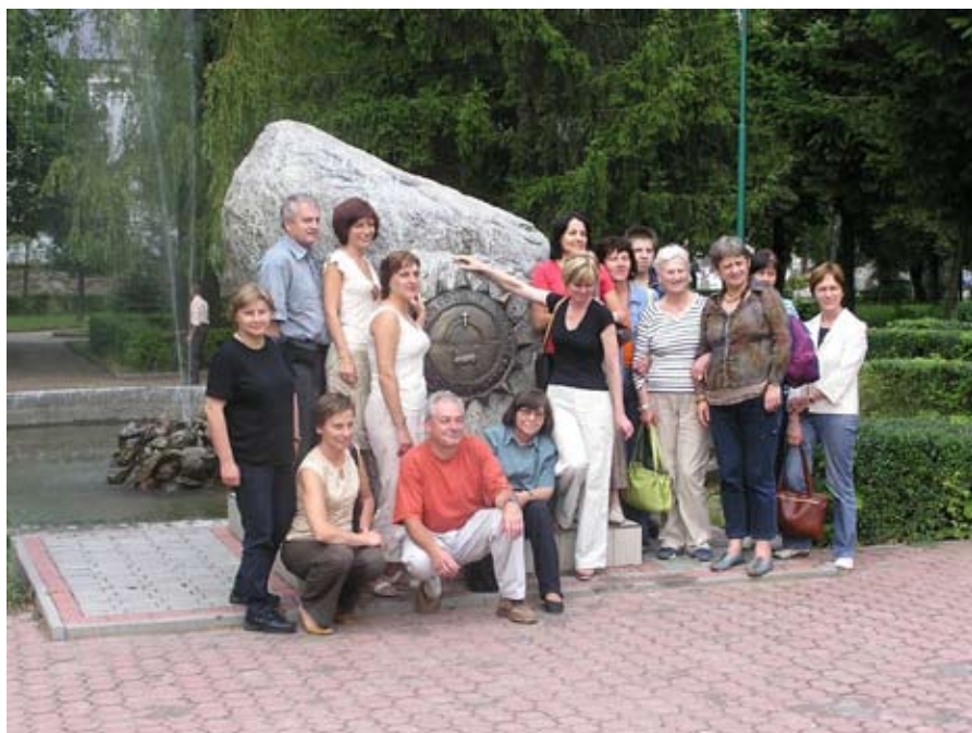
Suchowola, woj. podlaskie – geometryczny środek Europy