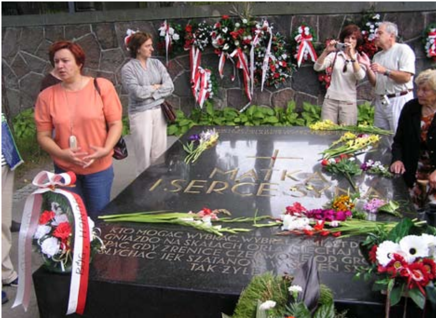
Mauzoleum Matka i Serce Syna, Wilno – Rossa Maria z Billewiczów i Józef Klemens Piłsudski