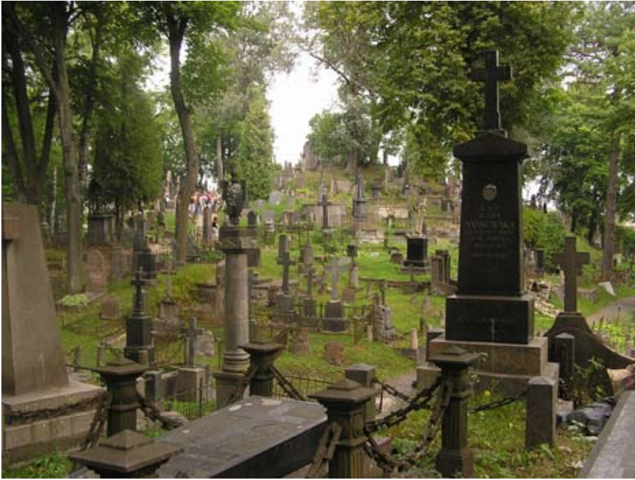
Cmentarz na Rossie w Wilnie