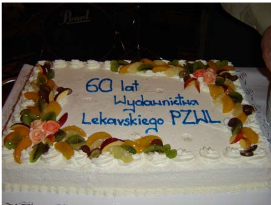
Jubileusz medycznej oficyny wydawniczej