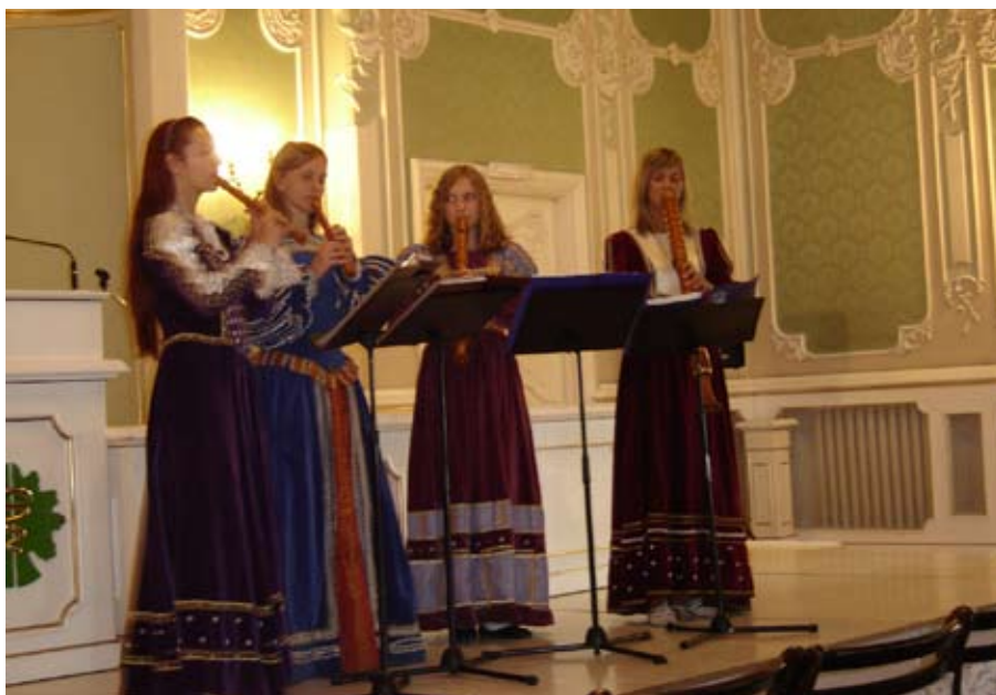
Zespół Fletów Prostych „Cantio Polonica”, Białystok