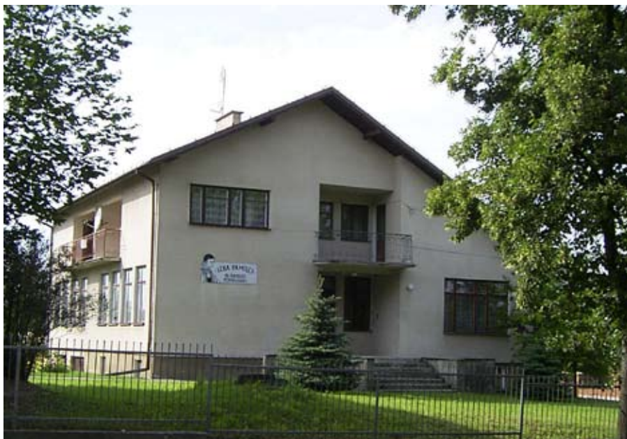
Izba Pamięci ks. Jerzego Popiełuszki w Suchowoli