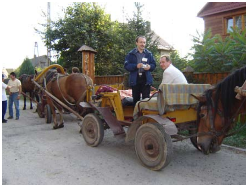
W Puszczy Białowieskiej