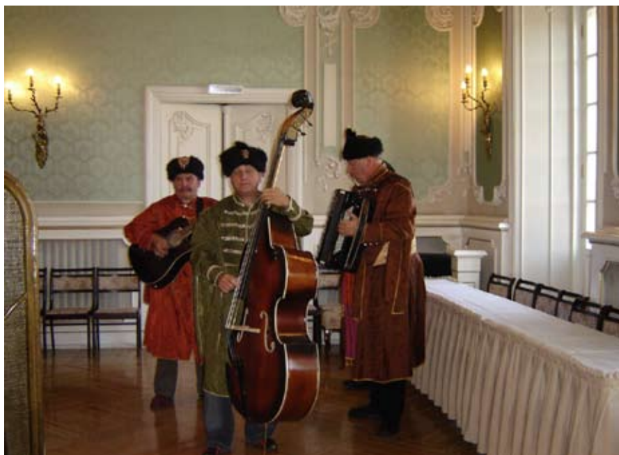
Kapela Jankiela, Białystok