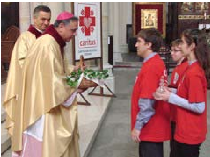
Wolontariusze ZDOH Caritas