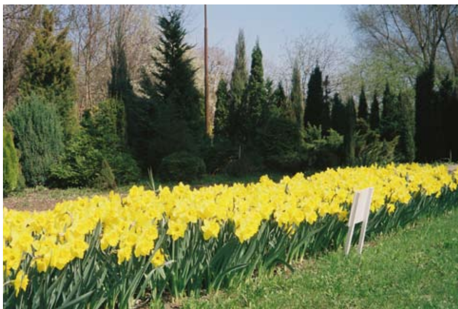
Wiosna 2010 – żonkile przed gmachem biblioteki uczelnianej