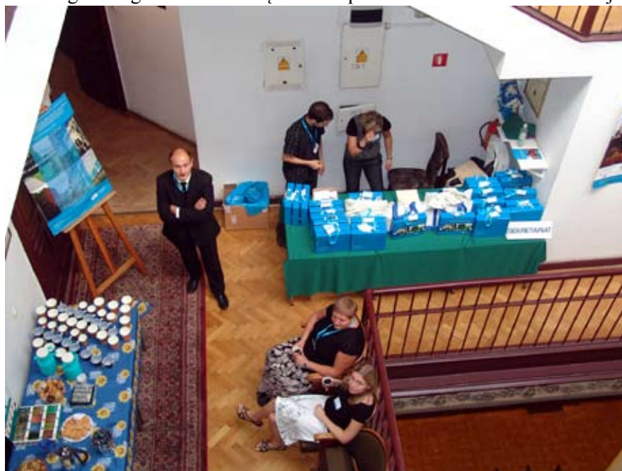
Zespół organizatorów Konferencji z lotu ptaka