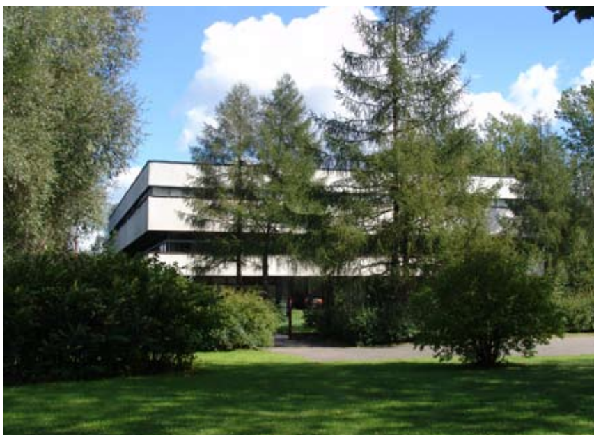
Gmach biblioteki uczelnianej