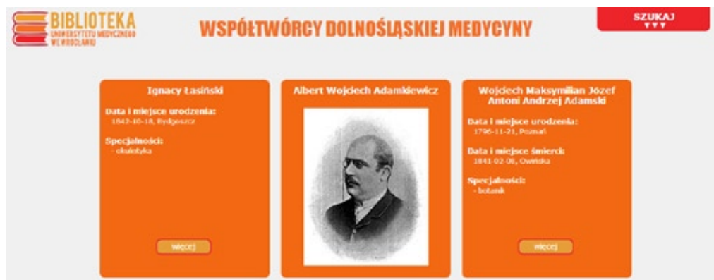
Ryc. 2. Baza „Współtwórcy Dolnośląskiej Medycyny”

Wybranie sylwetek i przygotowanie materiałów wymagało od uczestnika projektu średnio 50-60 godzin pracy. W wyniku tych prac do bazy „Współtwórcy dolnośląskiej medycyny” wprowadzono 201 haseł osobowych uzupełnionych o bibliografię osobową przedmiotową. Ilość pozycji bibliograficznych w hasłach osobowych jest różna w zależności od znalezionych materiałów źródłowych. Łącznie wprowadzono ponad 400 pozycji bibliograficznych. Źródłem danych biograficznych były wydawnictwa z zakresu