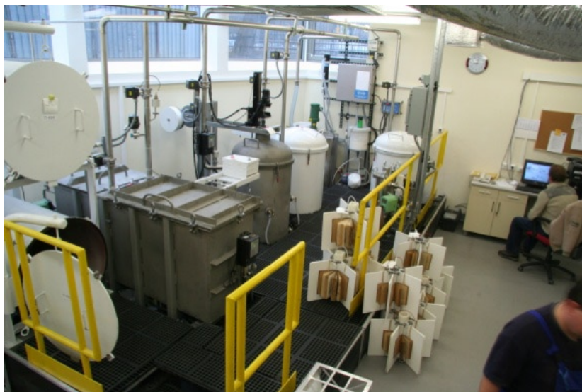
Instalacja do odkwaszania papieru w Klinice Papieru Biblioteki Jagiellońskiej