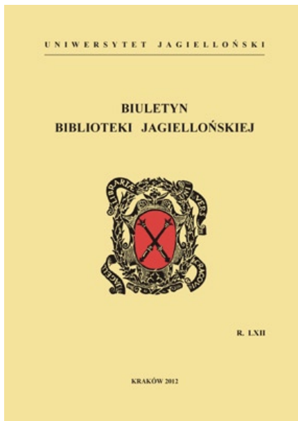
Okładka Biuletynu Biblioteki Jagiellońskiej