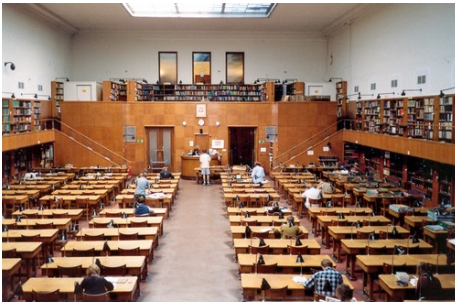
Czytelnia Główna Biblioteki Jagiellońskiej