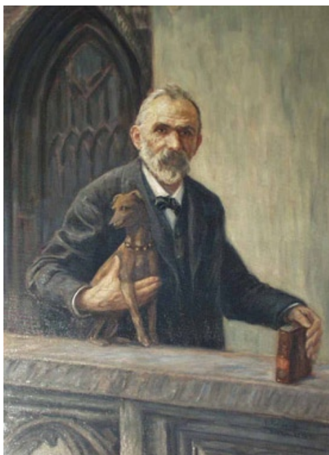
Il. 3. Karol Estreicher (1827-1908)

W ostatnich dekadach XIX w. biblioteka, nazywana coraz powszechniej Biblioteką Jagiellońską, była już zorganizowaną jednostką uniwersytecką z własną siedzibą, niewielkim budżetem, zarządem i personelem. Posiadała wartościowy, liczący ponad sto tysięcy woluminów księgozbiór, który był na nowo rozmieszczony i skatalogowany, oraz wypożyczany i udostępniany na miejscu w codziennie otwartej czytelni. Biblioteka, obficie zaopatrywana w polonika, pozyskiwane drogą nabytków i licznych darów, zaczęła pełnić, oprócz zadań biblioteki uniwersyteckiej, także rolę polskiej księżnicy narodowej, zyskując zaszczytne miano „Bibliotheca Patria”. Rozwój biblioteki, który przypadł na okres tzw. autonomii galicyjskiej, był w dużej mierze zasługą Karola Estreichera, wielkiego polskiego bibliografa, który zarządzał biblioteką w latach 1868-1905 7 .