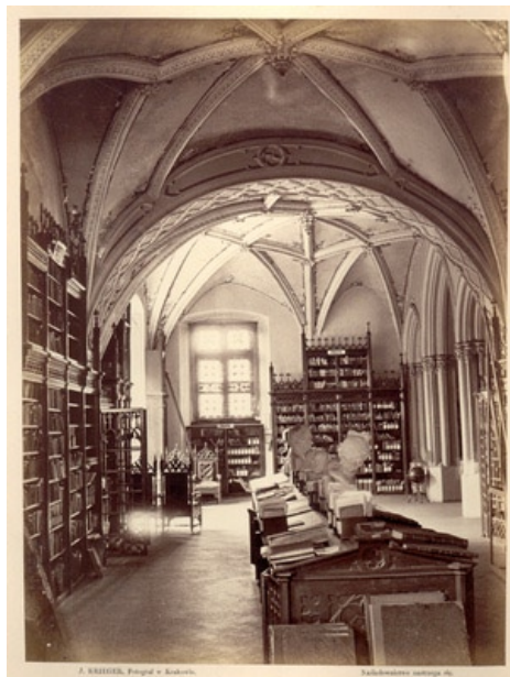
Sala Obiedzińskiego w Collegium Maius w XIX wieku