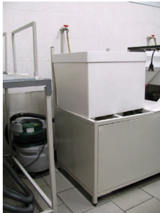
Maszyna do uzupełniania ubytków papieru