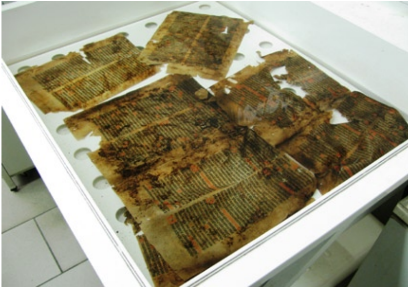
Kuweta do kąpeli wraz z materiałem zabytkowym