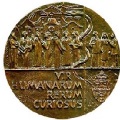
Medal im. Jana z Ludziska