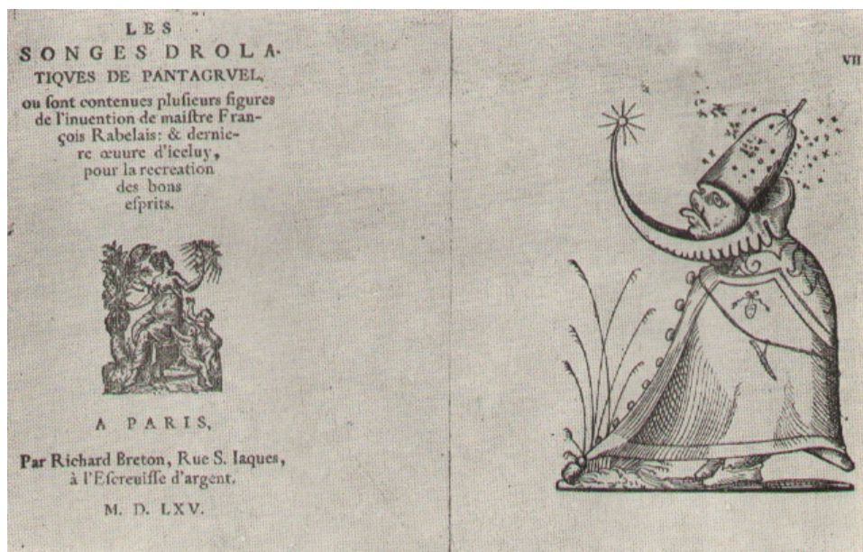
Karykatura Juliusza II z książki „Dziwaczne sny Pantagruela”, François Rabelais, Paryż 1565 r., drzeworyt wł. Biblioteka Kórnicka

Poza Niemcami i Włochami drukarstwo i drzeworytnictwo dotarło do Anglii (1477 r.), zagościło w Niderlandach, Francji, Czechach.