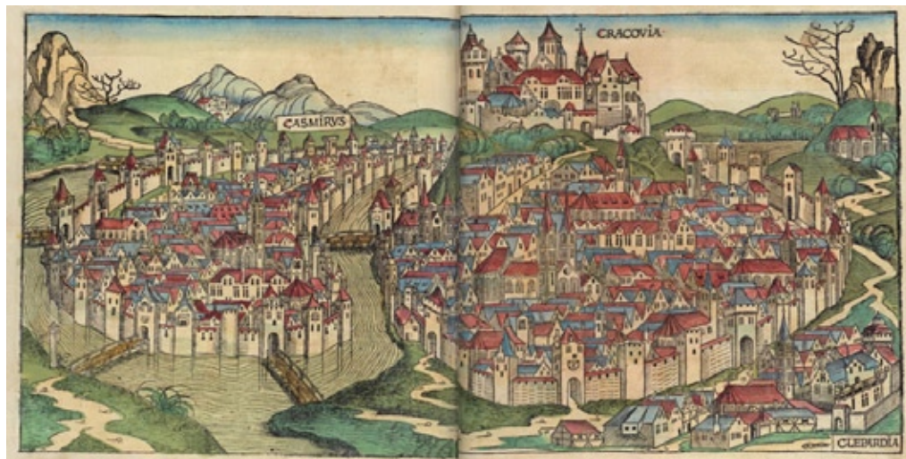
Chronica Mundi - Widok Krakowa 12

Słynną „ Kronikę Świata ” ( Chronica Mundi ) Hartmanna Schedla, drukowaną też przez wspomnianego Kobergera w 1493 r., ozdobiło około 2000 drzeworytów, w tym wiele całostronicowych. Rysunki do niej wykonali m. in.: Michael Wohlgemuth (frontispis) oraz jego pasierb Wilhelm Playdenwurf. To właśnie w „ Kronice ”, wśród widoków miast możemy obejrzyć Kraków, Wrocław czy Nysę.