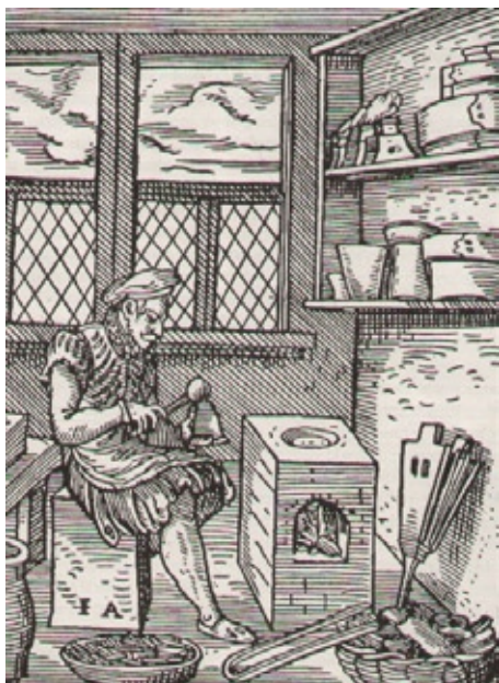
Drzeworyt Josta Ammana z 1568 r. przedstawiający odlewanie czcionek

Jednak już w XVII i XVIII stuleciu drzeworyt używany był rzadko, głównie przez artystów ludowych. Jego odrodzenie łączy się dopiero z wynalazkiem Thomasa Bewicka 16 , którego prace wykonane były po raz pierwszy z twardego drewna gruszy lub bukszpanu, a klocki cięte w poprzek słoików. Taki drzeworyt nazwany został sztorcowym (rylcowym), a Bewick - prekursorem drzeworytu nowoczesnego. Operował on kreską drobną, kładzioną gęsto w celu wydobycia walorów malarskich, naśladując tym technikę miedziorytu 17 , którą posługiwał się wcześniej. Po raz pierwszy zastosował nowy materiał – deskę sztorcową, nowe narzędzia – ryłce i igły, był również autorem rysunków, które sam wycinał i odbijał.