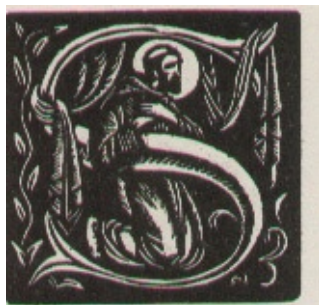
Władysław Skoczylas, Inicjał S drzeworyt 1923 r.