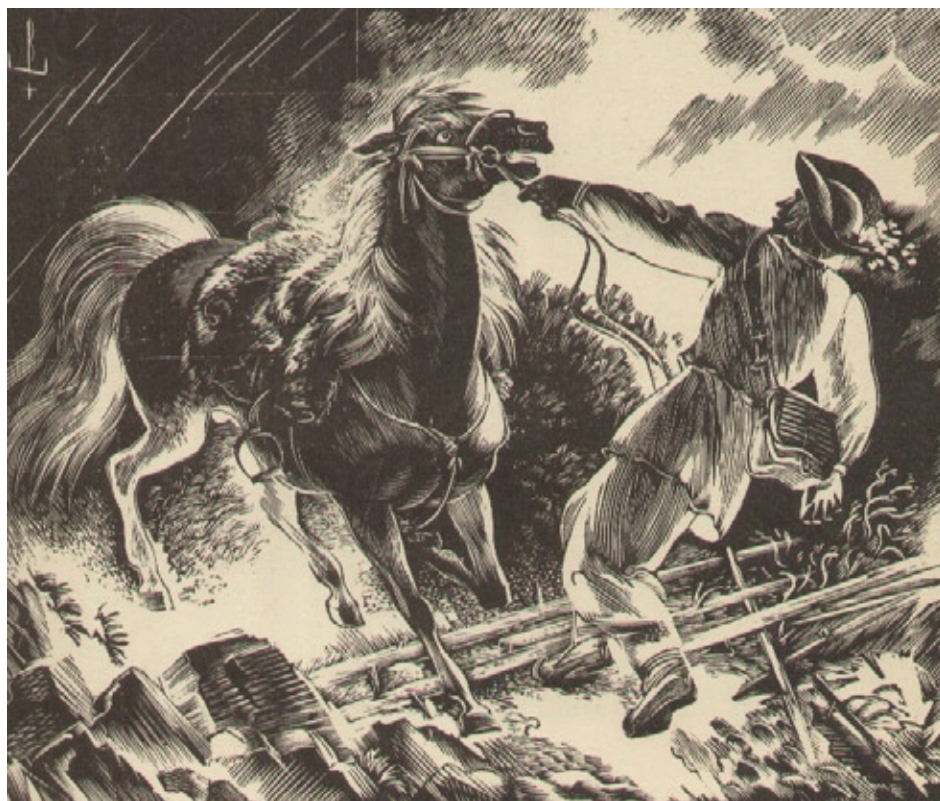
Edmund Bartłomiejczyk, Błyskawica, drzeworyt 1936 r.

drzeworytu negatywowego, jaki uprawiał zgodnie z nauką Skoczylasa, do drzeworytu pozytywowego, będącego następstwem zetknięcia się artysty z działalnością Adama Póltawskiego. Wprowadzenie tej odmiany drzeworytu wypłynęło także z przekonania, że drzeworyt komponowany czarno na białym tle, zestrąja się lepiej z kolumną tekstu. Pogląd taki wywołał sprzeciw wielu uczniów Skoczylasa, szczególnie Tadeusza Cieślowskiego syna.