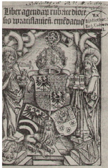
Karta tytułowa z „Liber agendae” wyd. 1510 r. drzeworyt, wł. Biblioteki Uniwersyteckiej w Poznaniu

Później na tych samych klockach, co ryciny, wycinano zwięzłe teksty. Sporządzone z tych odbitek zeszyty były pierwszymi książkami drzeworytowymi. W ten sposób powstawały tzw. książki ksylograficzne, dziś bardzo rzadkie i cenne (pierwsze z roku 1475) 10 . Oczywiście stało się, że rycina istniała przed drukiem, a książki ksylograficzne składające się z drzeworytów z podpisami lub bez, poprzedziły książkę współczesną.