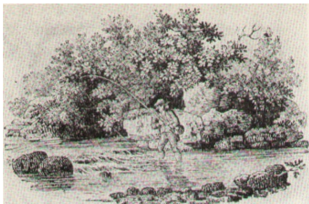
Drzeworyt sztorcowy Thomasa Bewicka