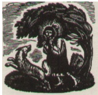
Władysław Skoczylas, Dobry pasterz winieta, drzeworyt 1924 r.

część do ówczesnej secesji i sztuki angielskich prerafaelitów. Dominujący wówczas modernizm, impresjonizm i secesja znalazły odbicie w grafice. Wpływ tych nurtów stał się widoczny również w grafice polskiej.