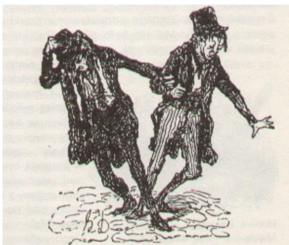
Honoré Daumier 26 , Dwóch pijaków drzeworyt

Wykonywane bez pośredników, w pełni odzwierciedlały zamierzenia artysty; często zniekształcane przez rzemieślników - rytowników, których posiadał wcześniej uprawiany drzeworyt.