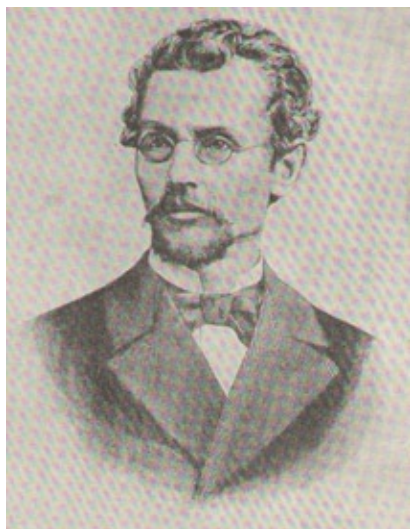
Józef Holewiński, Bolesław Prus drzeworyt interpretacyjny

wianego przy wykorzystaniu drzeworytu sztorcowego. Właśnie wtedy pojawiło się samo pojęcie „ilustracja”, w potocznie dziś używanym rozumieniu rysunku objaśniającego lub uzupełniającego tekst. W II połowie XIX wieku drzeworyt sztorcowy niepodzielnie zapanował, jako technika ilustracyjna. Tańszy, wygodniejszy w użyciu i wciąż udoskonalany idealnie spełniał wymagania stawiane ilustracji książkowej.