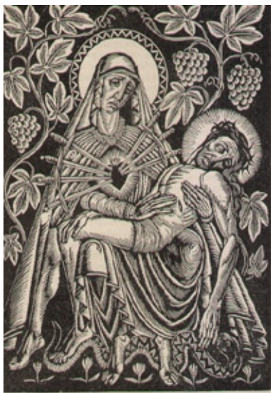
Władysław Skoczylas, Pieta, drzeworyt 1928 r.