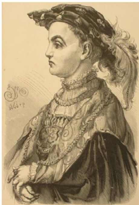
Portret młodego Zygmunta Augusta.

Rysował na klocku drewnianym Jan Matejko i sygnował po lewej stronie na środku: