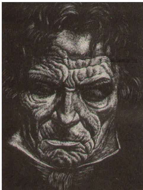
Władysław Skoczylas, Beethoven, drzeworyt 1929 r.