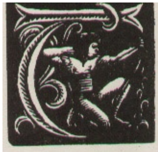
Władysław Skoczylas, Inicjał T, drzeworyt 1923 r.