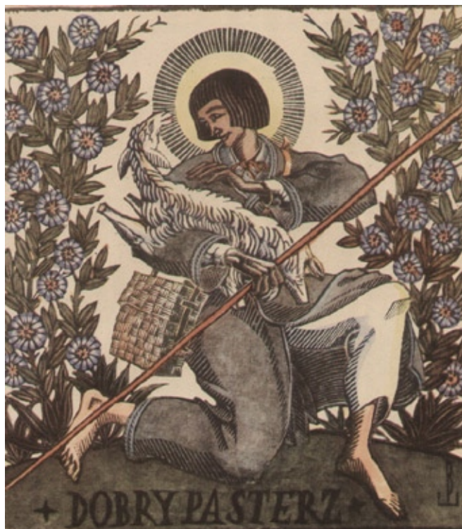
Edmund Bartłomiejczyk, Dobry Pasterz, drzeworyt kolorowany 1924 r.