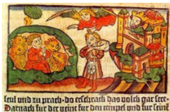
Hand-coloured woodcut of Daniel in the Lions' Den, from the Historie von Joseph, Daniel, Judith und Esther , printed in 1462 at Bamberg by Albrecht Pfister 8

Artysta zdecydowaną kreską zaznaczał kontury postaci, drzeworytnik – rzemieślnik wycinał powierzchnię w klocku sporządzonym z miękkiego drewna ciętego wzdłuż słojów 6 , zostawiając jedynie nienaruszone ślady obrysujących linii, wypukłe w reliefie wyciętego klocka. Na odbitkach, podobnie jak tusz czy ołówek, czarnym konturem wyznaczały one zarysy kompozycji 7 . Technika rozpowszechniła się, ponieważ dzięki niej potrafiono w sposób łatwy i tani powielać kosztowne obrazy, z reguły trudno dostępne, zamknięte w kościelnych czy klasztornych murach. W czarno – białych rycinach, rażąca biel zamalowywano ręcznie farbami, starając się zbliżyć wizerunek w drzeworycie do wizerunku na obrazie, czy witrażu.