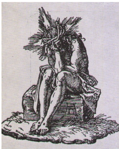
Albrecht Dürer, Chrystus frasobliwy, frontispis z Małej Pasji, drzeworyt 1509-1511