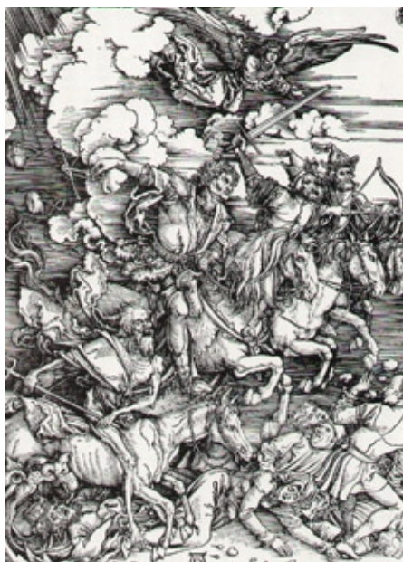
Albrecht Dürer, Czterech jeźdźców z cyklu drzeworytów Apokalipsa 1497/1498