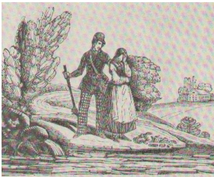
Wincenty Smokowski, Ilustracja do „Witoloraudy” Józefa Ignacego Kraszewskiego, Wilno drzeworyt 1846 r.

Historia drzeworytu w Polsce XIX wieku związana była nierozdzielnie z przemianami w sztuce europejskiej w tym okresie. Zasluga rozbudzenia zainteresowania drzeworytem ilustracyjnym przypadła Wincentemu Smokowskiemu 29 . Artyście udało się stworzyć w drzeworycie własny styl. Być może Smokowski sam pragnął połączyć prace rysownika i grafika, a może słyszał o wynalazku Bewicka? Faktem jest, że - jak Bewick – używał twardych klocków ciętych w poprzek słoju i podobnie, jak Anglik, wszystkie drzeworyty związał z ilustratorstwem i zdobnictwem książkowym. Po wielu latach, w okresie wspaniałego rozkwitu drzeworytu nowoczesnego, uznano Smokowskiego za polskiego prekursora tak uprawianej grafiki.