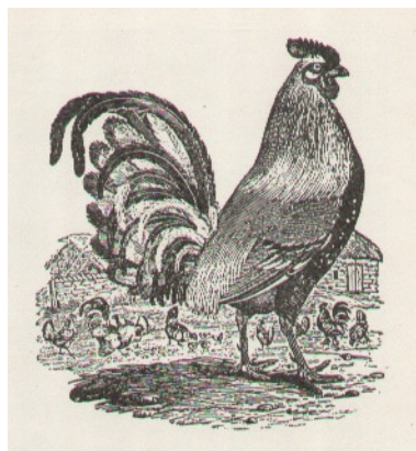
Thomas Bewick, Kogut drzeworyt

dzo ekonomiczne w użyciu: lżejsze, tańsze i bardziej podatne niż płyty miedziane, zarówno przy sporządzaniu rycin, jak i odbijaniu. Pozwalały na wykonanie dużej ilości odbitek, co miało ogromne znaczenie w dobie rozwoju wysokonakładowych, bogato ilustrowanych czasopism.