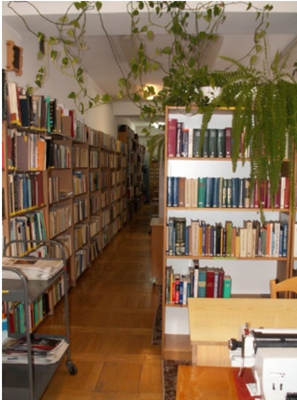
Magazyn druków zwartych

Biblioteka zyskiwała coraz większe uznanie w środowisku, rozwijała się. Ze względu na dostępność i ogólnomedyczny profil zbiorów z usług Oddziału korzystał szeroki i bardzo zróżnicowany krąg użytkowników.