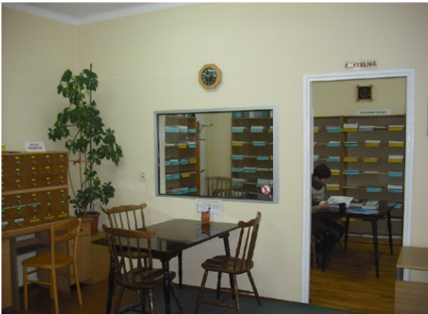
Wypożyczalnia i czytelnia w nowej siedzibie

Obecnie posiadamy księgozbiór liczący 7 462 wol. druków zwartych oraz 1 771 wol. roczników czasopism.