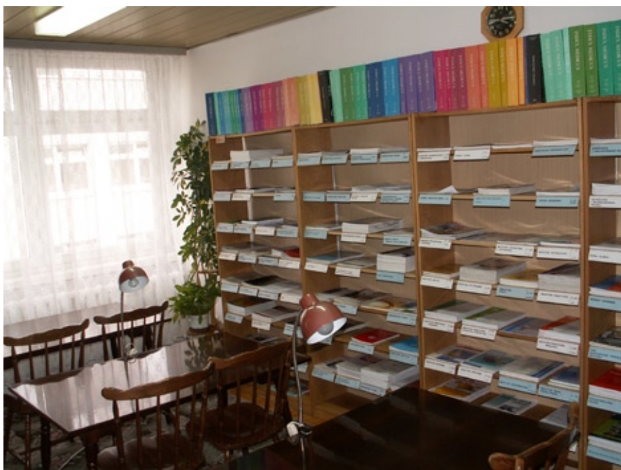
Czytelnia czasopism w Wojewódzkim Szpitalu Specjalistycznym

Jak bardzo losy biblioteki były bliskie środowisku, świadczył fakt, że w poszukiwanie lokalu włączyły się instytucje medyczne, władze miasta, lekarze, a nawet osoby prywatne.