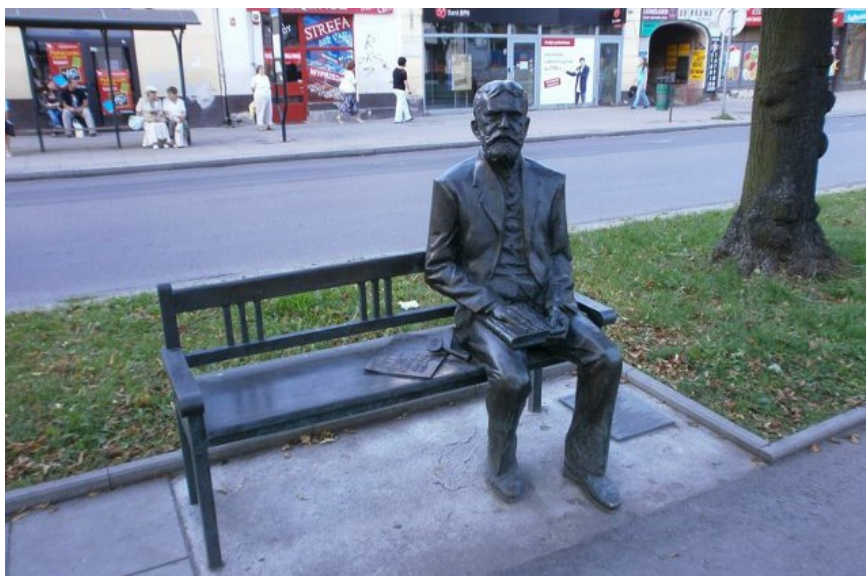
Ławeczka dr Władysława Biegańskiego

Od początku działalności, kierownik biblioteki zapraszany był na posiedzenia Zarządu TLCz i uczestniczył w organizacji i przygotowywaniu takich wydarzeń jak np. sesje naukowe, seminaria, kongresy, wystawy.