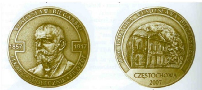
Medal okolicznościowy wydany z okazji Roku Doktora Władysława Biegańskiego