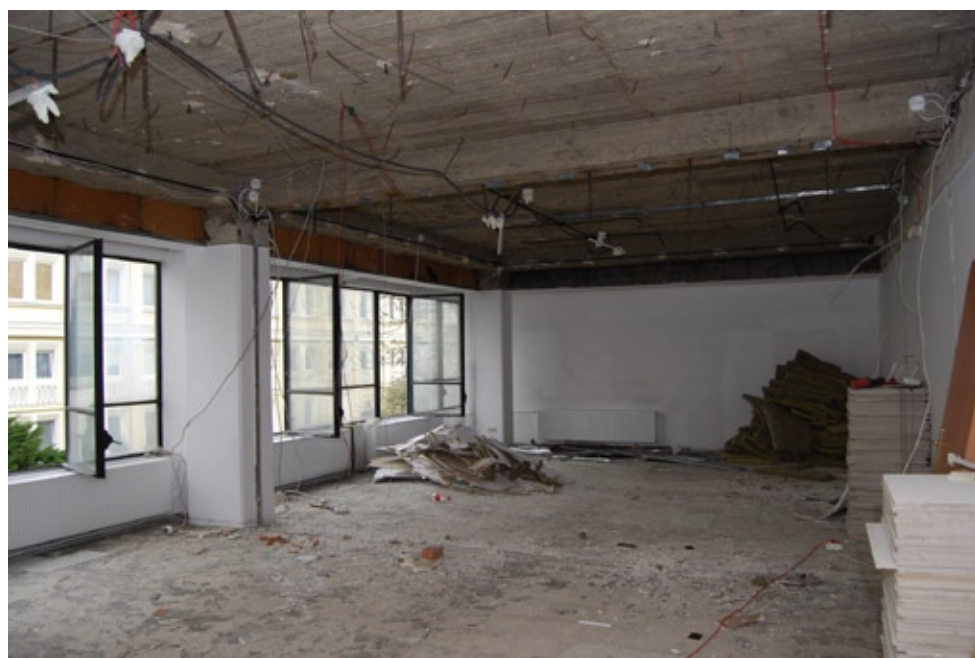
Modernizacja starej części budynku