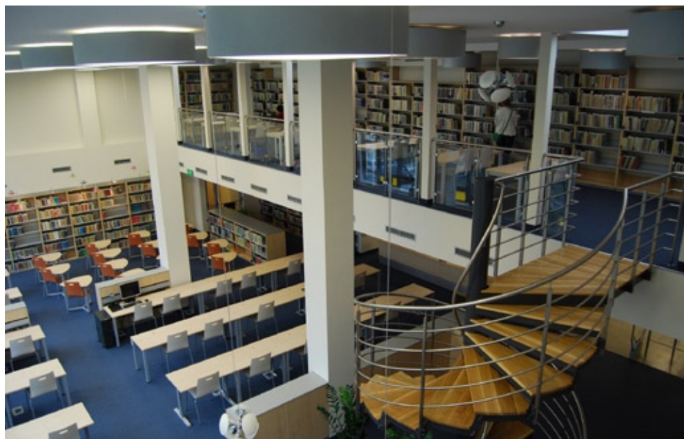
Czytelnia Główna po modernizacji