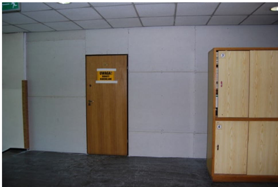
Tymczasowa ściana odgradzająca stary budynek od dobudowywanego modułu