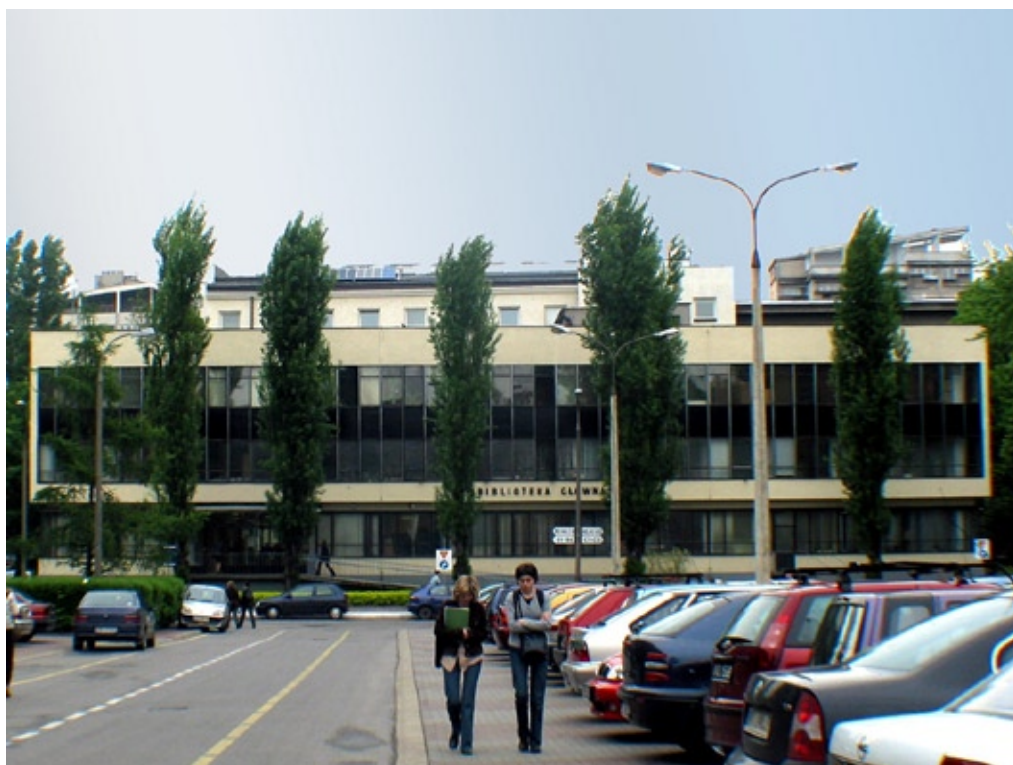
Budynek BG AGH przed modernizacją

Od wielu lat marzyła się nam nowoczesna biblioteka, z wolnym dostępem do zbiorów, z odpowiednimi przestrzeniami wypoczynkowymi dla użytkowników. Bez dodatkowej powierzchni i modernizacji całości budynku nie byłoby to możliwe. Od lutego 2014 roku Biblioteka działa już w pełnym zakresie. Liczba odwiedzających ją użytkowników, szczególnie studentów, świadczy o tym, że spełnione zostały ich oczekiwania, że czują się tu dobrze nie tylko dlatego, że są obsługiwani w sposób profesjonalny i życzliwy, że stworzono im komfortowe warunki do nauki, ale też dlatego, że zorganizowano im strefy, gdzie mogą spędzić czas wolny pomiędzy zajęciami 7 .