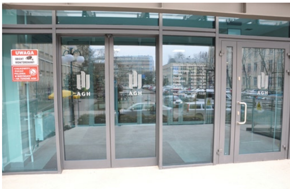
Drzwi frontowe po modernizacji elewacji południowej