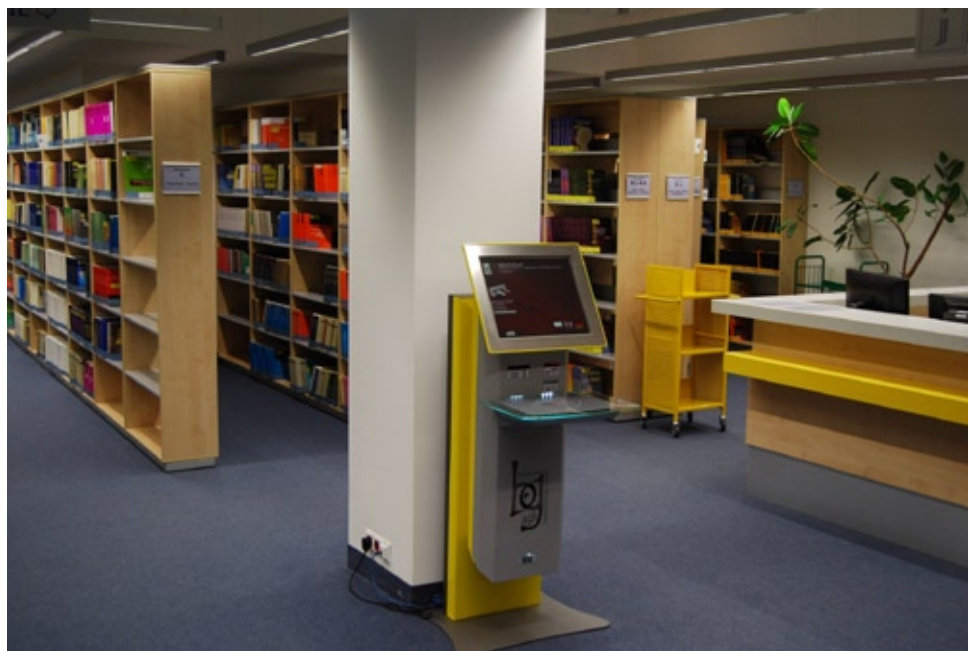
Strefa Wolnego Dostępu