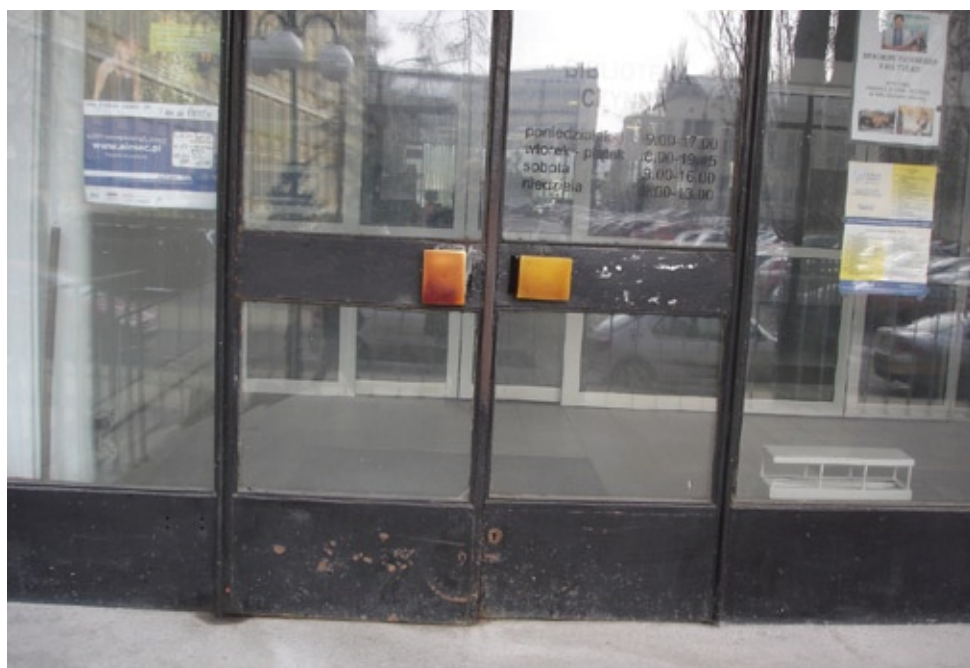
Drzwi frontowe przed modernizacją elewacji południowej