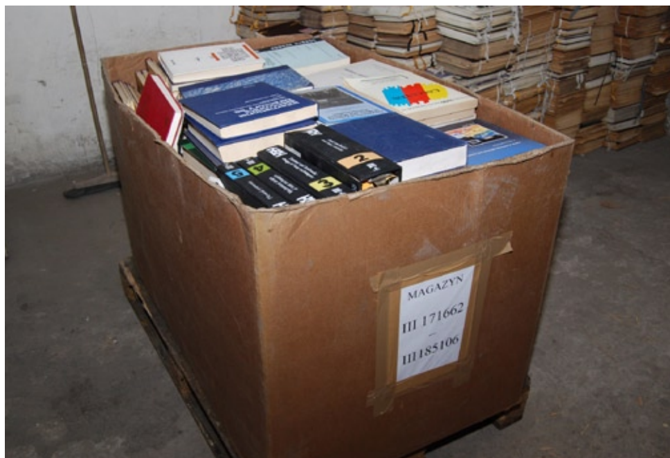
Część księgozbioru na czas remontu wywieziono na Miasteczko Studenckie