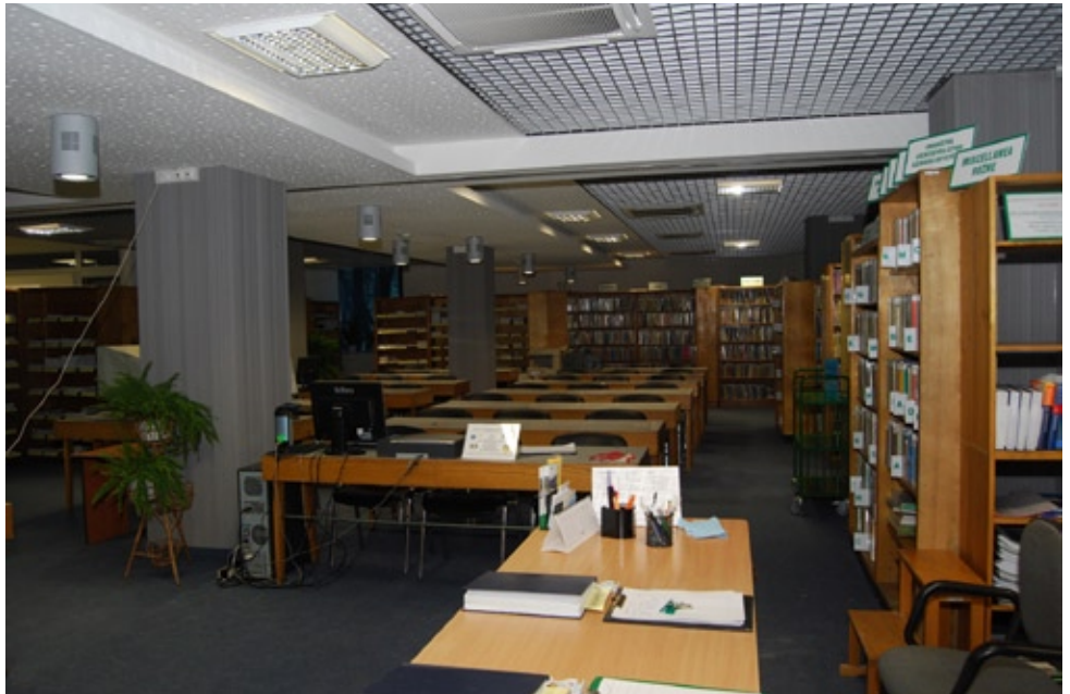
Tymczasowo zorganizowana Czytelnia Główna w pomieszczeniu przyszłej Czytelni Książek Własnych