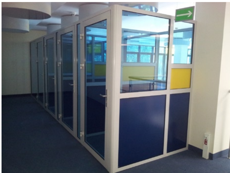
Pokoje pracy indywidualnej