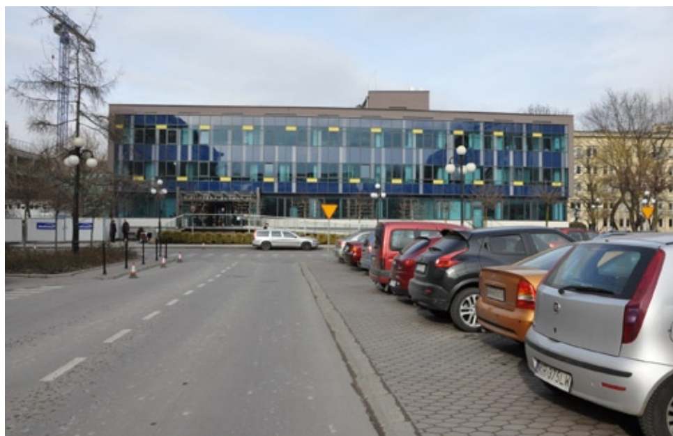
Budynek BG AGH po modernizacji