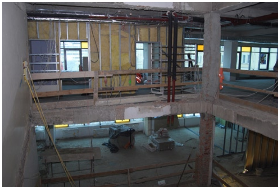
Modernizacja starej części budynku