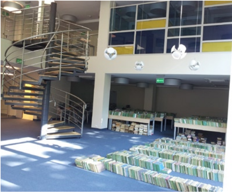
Czytelnia Główna – w oczekiwaniu na regały