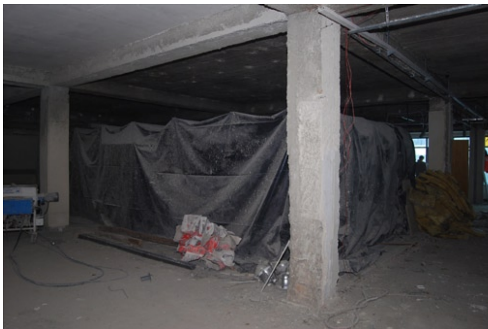
Regały z księgozbiorem na placu budowy