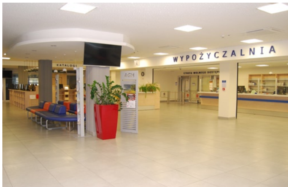
Główny hol, Wypożyczalnia, Katalogi, przejście do Strefy Wolnego Dostępu