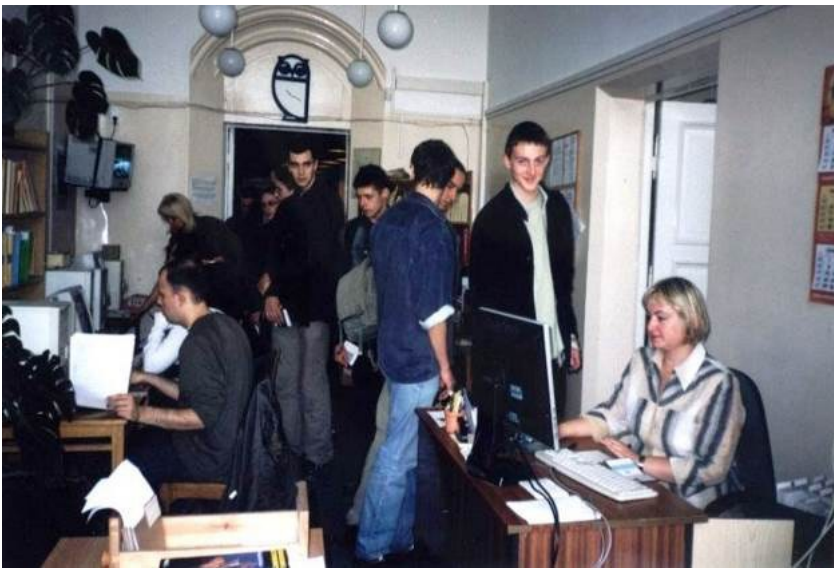
Oddział Informacji Naukowej w Bibliotece Głównej Politechniki Szczecińskiej