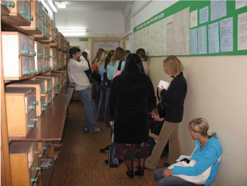
Hall katalogowy w Bibliotece Głównej Akademii Rolniczej w Szczecinie