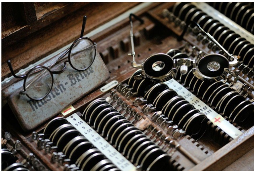
Fragment wyposażenia gabinetu okulistycznego.