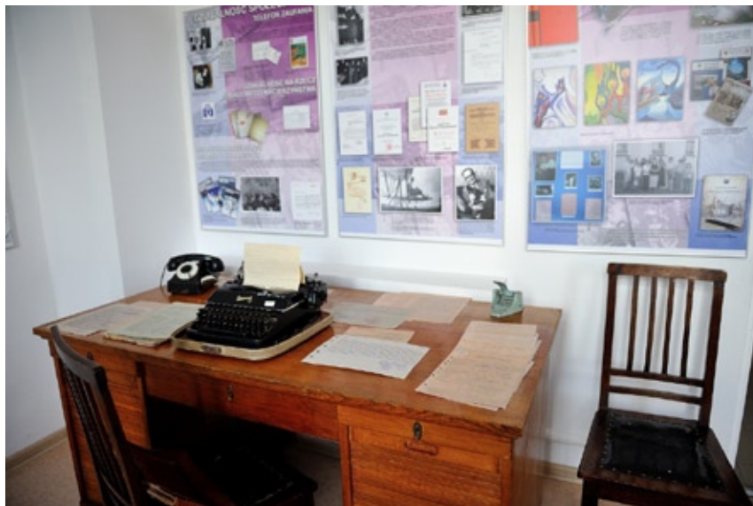
Sala historii UMB. Zbiory Samodzielnej Pracowni Historii Medycyny i Farmacji UMB